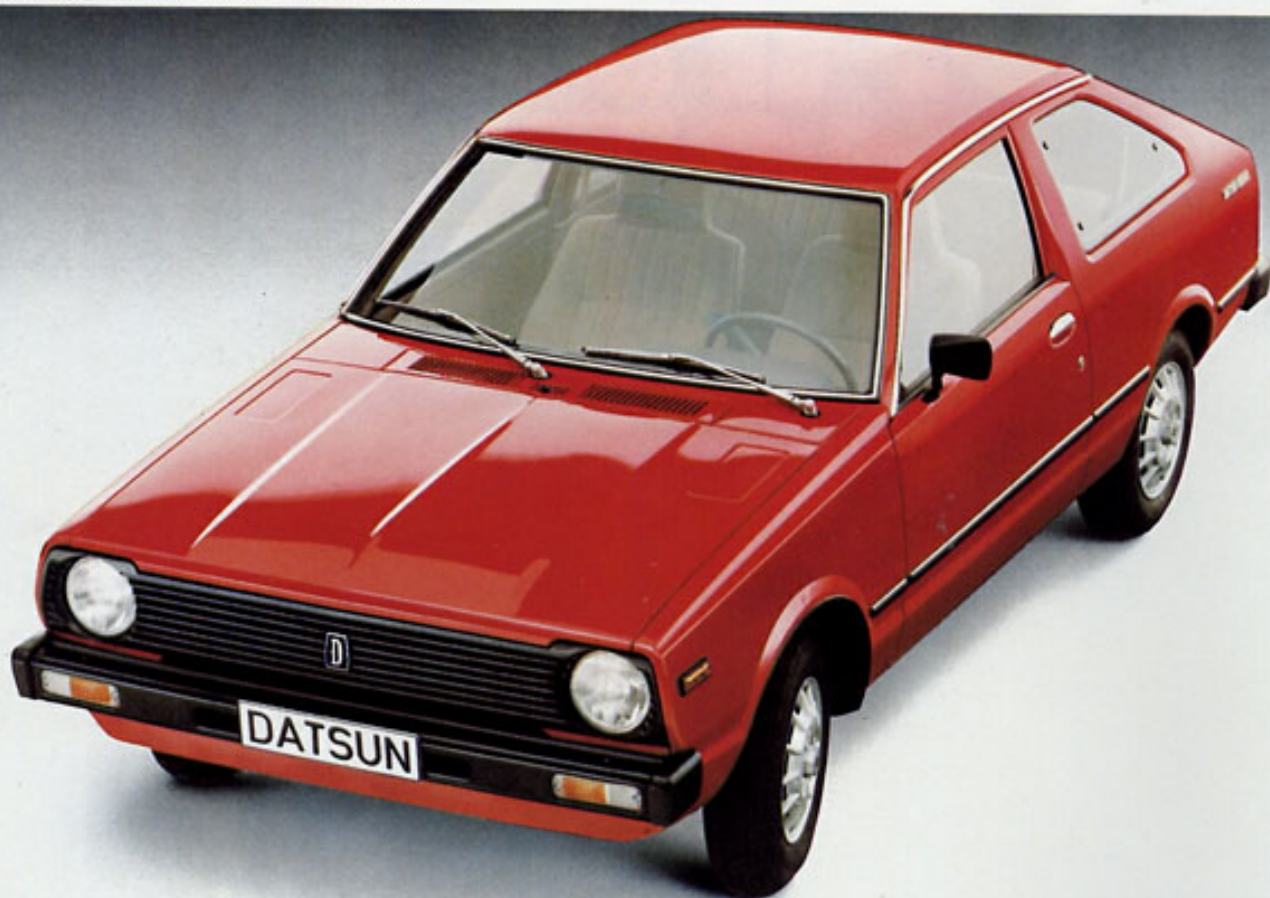
Cherry Limousine: Komfort in kompakter Form und weitöffnender Heckklappe

Wer ein Auto in erster Linie als wirtschaftlich notwendige Investition kalkuliert. Wem Zuverlässigkeit die wichtigste Eigenschaft unter Freunden ist. Wer lieber Partnerschaft auf Dauer eingeht statt aufregend zu experimentieren, wer also Langlebigkeit und Wirtschaftlichkeit von einem Wagen fordert, der könnte bei einer Probefahrt mit dem Datsun Cherry ganz schnell auf Touren kommen.