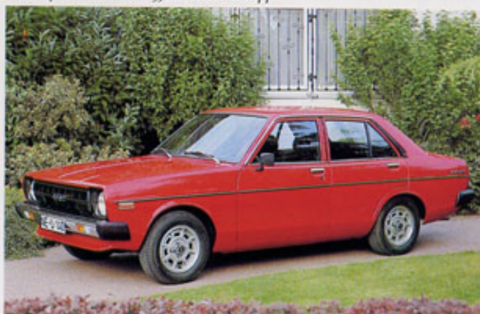
Sunny 4-türiger: Genau richtig für Familien