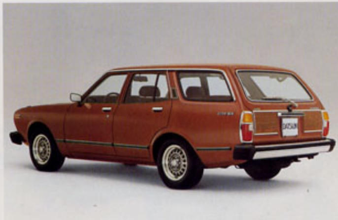
Bluebird Combi: Das Familien-Freizeit-Berufs-Auto mit 500 kg Zuladung

Dazu gehört beim Bluebird einfach alles – serienmäßig: die Doppelscheinwerfer, das Lederlenkrad, die getönten Scheiben, höhenverstellbarer Fahrersitz mit Lendenwirbelstütze, Seitenscheiben-Defroster, Quartz-Zeituhr, das Sicherheits-Kontrollsystem für 10 wichtige Funktionen. Das alles sind Extras, die nichts extra kosten.