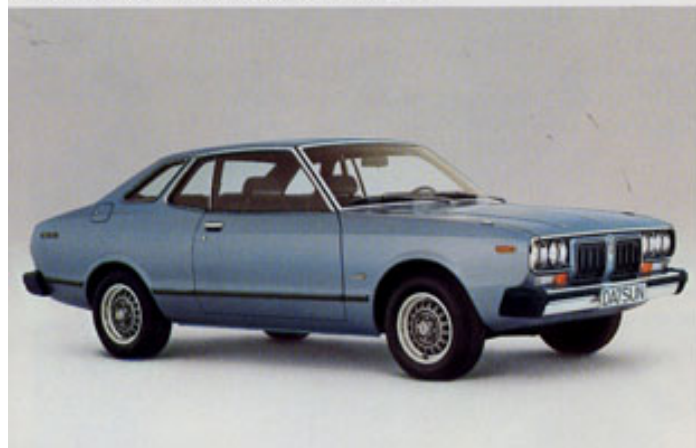
Bluebird Coupé: Sportliche Version mit 5 Gängen