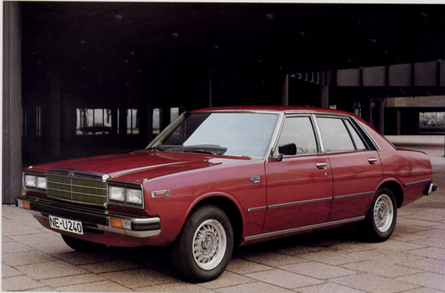
Laurel 240: Seine Eleganz ist der Ausdruck überlegenen Fahrkomforts

Dieses Auto hat Format. Eine 2,0 bzw. 2,4-Liter-Sechszylindermaschine beschert, zusammen mit dem aufwendigen Fahrwerk ein exzellentes Fahrvergnügen. Mit seiner exklusiven Linienführung und komfortablen Ausstattung geht dieses Fahrzeug weit über das übliche Maß hinaus: Das ist Fahren erster Klasse, aber nicht zum Erste-Klasse-Preis. Denn auch sein Preis ist wirtschaftlich.