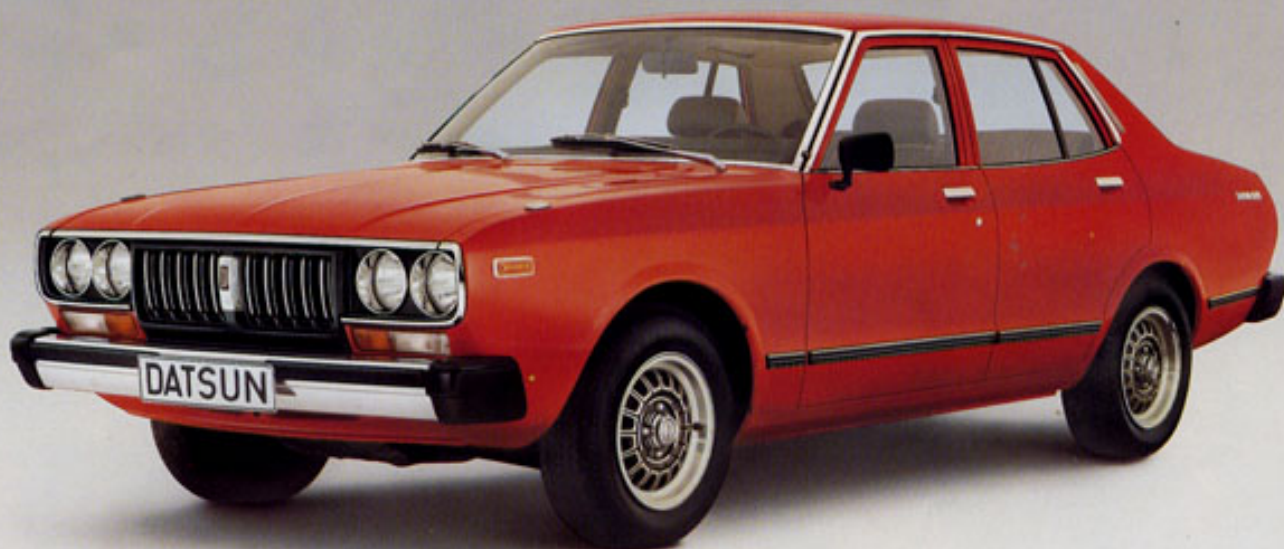
Bluebird Limousine: Großzügig und leistungsstark

Gelassene Großzügigkeit, zuverlässige Technik und die komplette Komfort-Ausstattung kennzeichnen die kultivierte Erscheinung dieses leistungsfähigen, familienfreundlichen Automobils. Als attraktiver Normalbenzinverbraucher stellt sich der Bluebird als ein würdiger Vertreter seiner Marke dar: Sparsam in den Ansprüchen, großzügig in der Leistung – wirtschaftlich wie alle Datsun.