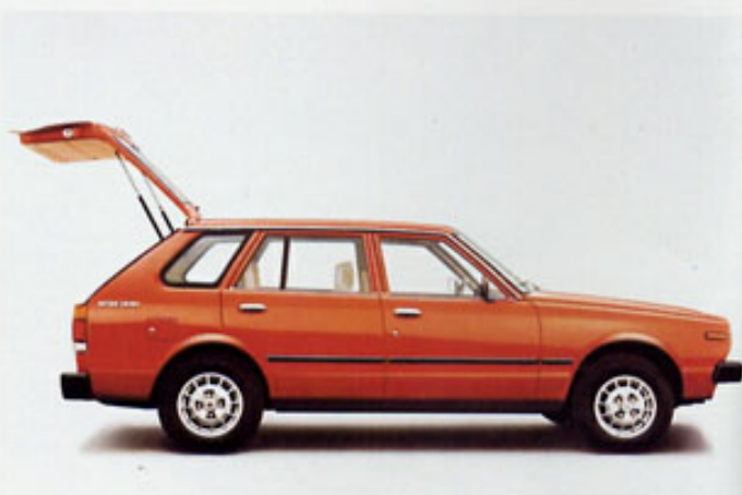
Cherry Combi: Große Heckklappe, variabler Innenraum für 400 kg Zuladung

Der Cherry läßt keine Extra-Wünsche offen, denn Extras sind bei allen Datsun inklusive: Halogen-Hauptscheinwerfer, Drehzahlmesser, Colorverglasung, Verbundglas-Frontscheibe, Velours-Teppichboden, 2stufige Scheibenwisch-/Waschanlage mit Intervall-Schaltung und Heckscheiben-Wischer und -Wascher – um nur einen kleinen Eindruck zu geben.