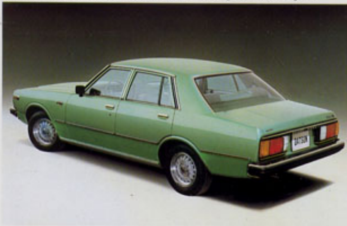
Laurel 200: Er verbindet noble Exklusivität mit Wirtschaftlichkeit