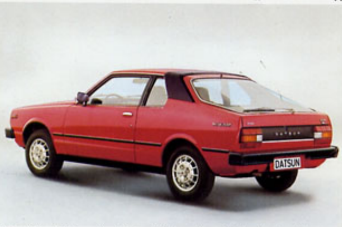
Cherry Coupé: Die rassige 5-Gang-Version mit weitöffnender Heckklappe