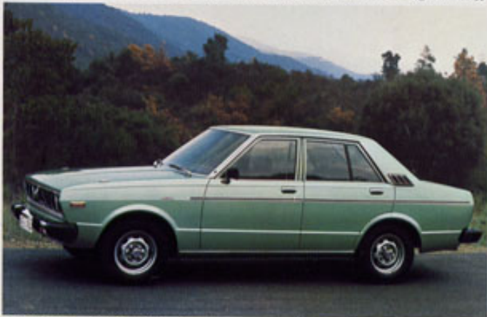
Violet Limousine: Ergebnis einer konsequenten Konzeption