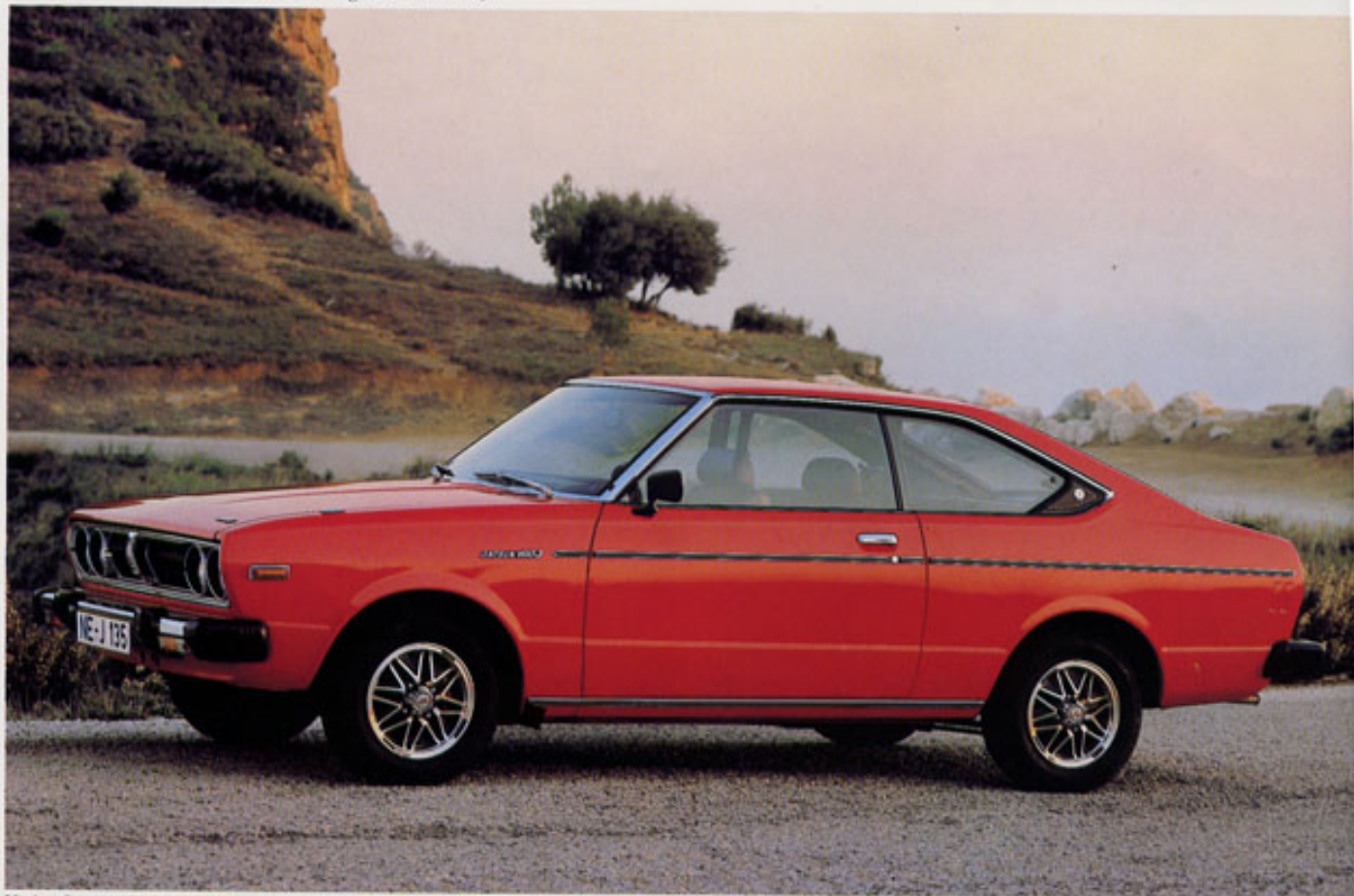
Violet Coupé: Ein besonderes Temperament in jedem seiner 5 Gänge, weitöffnende Heckklappe

Siege und vordere Plazierungen bei internationalen Rallyes. In Reihenfolge war immer ein Violet Coupé oder ein Limousine in wichtigen Prüfungen vorne. Die Erfolgschronik liest sich wie folgt: 1979 Gesamtsieger und 1977 1. Platz ihrer Klasse für die Limousine in der East-African Safari. 1975 und 1977: 1. Platz für das Coupé in der Southern Cross, Australien, (1977 sogar Plätze 1-5).