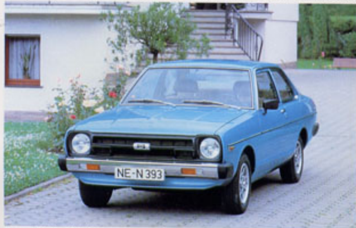
Sunny 2-türiger: Die konsequent moderne Konzeption