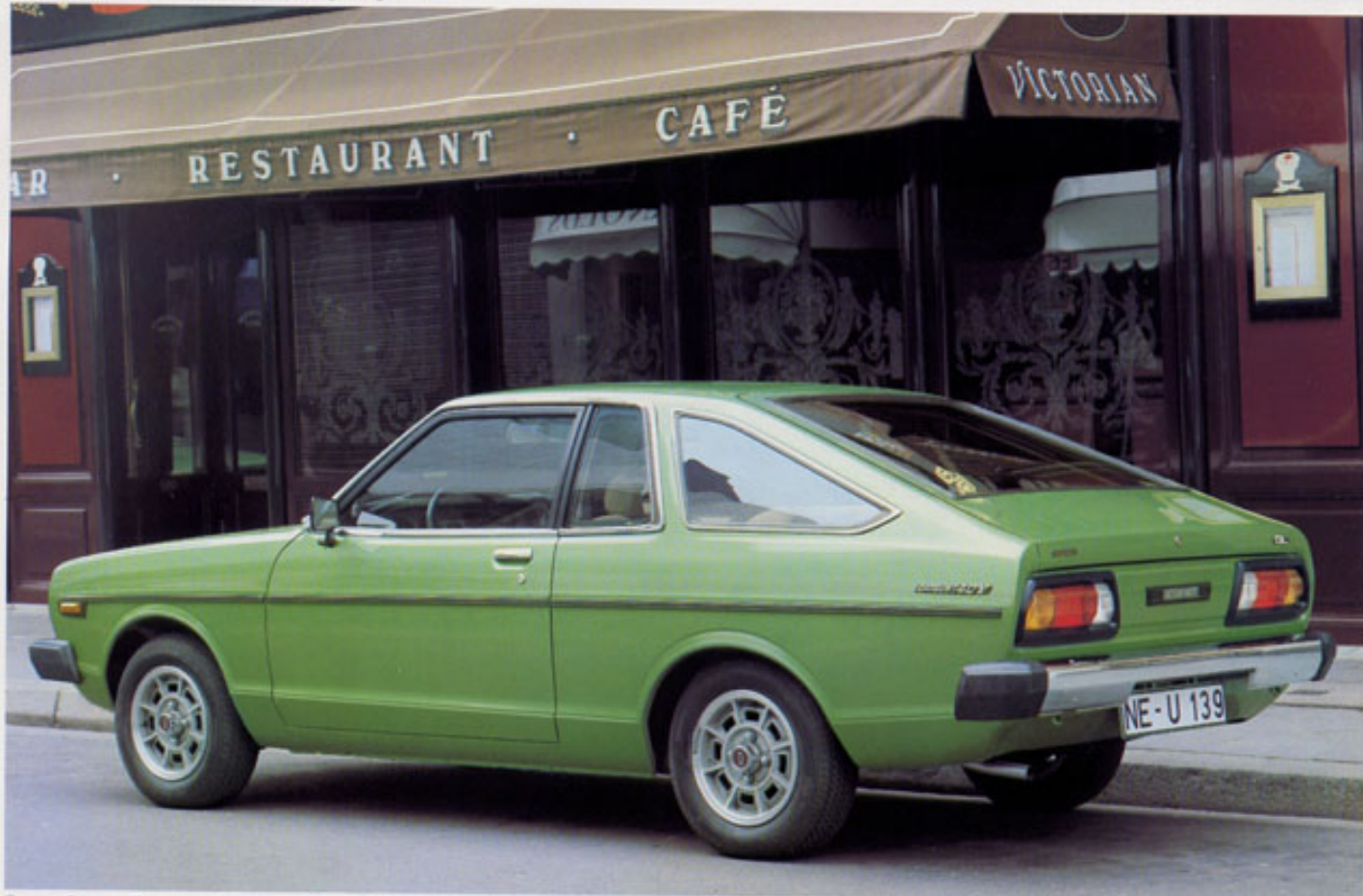
Sunny Coupé: Ein sportliches Auto, das Fahrfreude und Sparsamkeit verbindet. Dazu die praktische, weitöffnende Heckklappe

Er ist das sonnige Ergebnis konsequenter Entwicklungsarbeit. Klare Linienführung als äußeres Merkmal einer modernen Konzeption. Kraft, Sparsamkeit, Vielseitigkeit sind die hervorstechenden Merkmale dieser komfortablen Fahrzeugreihe. Der Sunny – einfach ein Auto für Leute mit den gleichen Eigenschaften. Hinzu kommt die bei Datsun typische Zuverlässigkeit und Langlebigkeit.