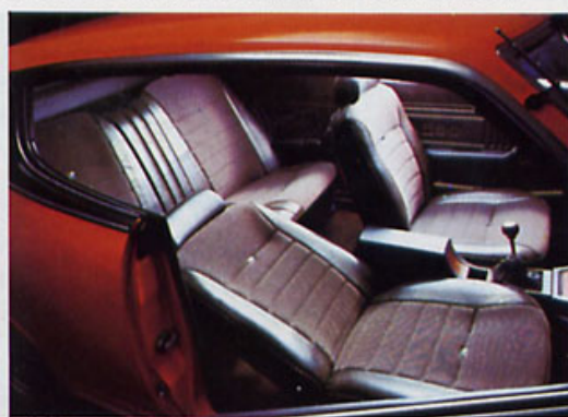
Anatomisch richtig geformte Sitze mit Kopfstützen vorn.