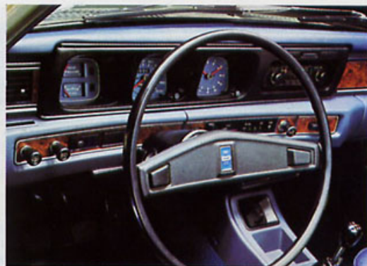
Funktionsgerechtes Rund-Cockpit mit absolut blendfreier Instrumentierung und leicht zu erreichenden Bedienungselementen.