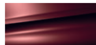
Rosso Ciliegia (M)**