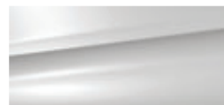
Bianco Banquise (O)