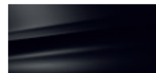
Nero Ossidiana (M)