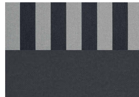
Tessuto Rayure Nero e Bianco