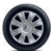
Copricerchi Inca 15"