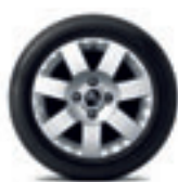
Cerchi in lega Coyote 15"