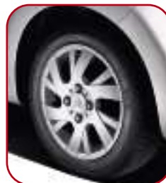
Cerchi in lega 14" SPAZZ