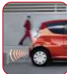
I sensori di parcheggio anteriori e posteriori vi permettono di parcheggiare in modo più veloce.