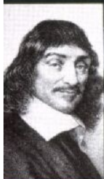
René Descartes 1596-1650 Mathematiker und Philosoph