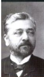
Gustave Eiffel 1832-1923 Ingenieur