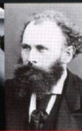
Edouard Manet 1832-1883 Maler