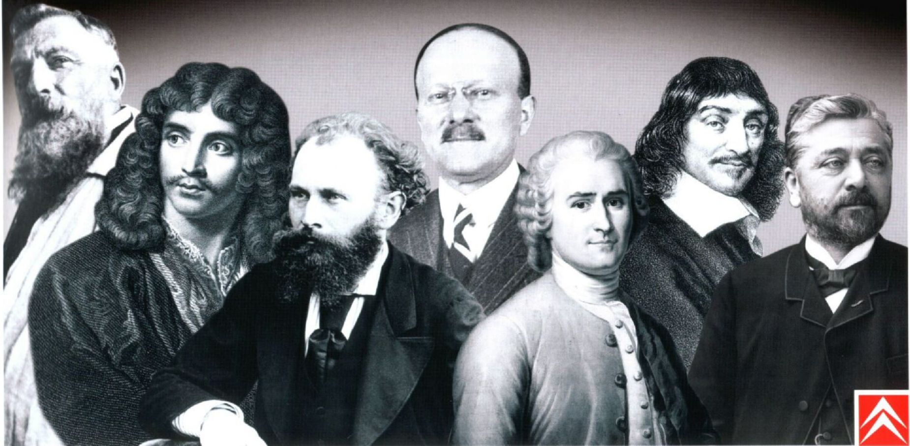
Gustave Eiffel 1832-1923