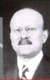
André Citroën 1878-1935 Automobilkonstrukteur