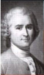
Jean-Jacques Rousseau 1712-1778 Philosoph