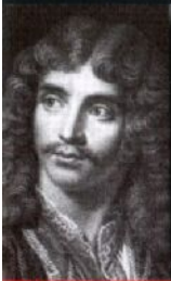
Molière 1622-1673 Theaterdirektor und Dramatiker