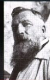
Auguste Rodin 1840-1917 Bildhauer