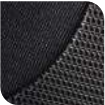
Tejido Simailla Gris oscuro