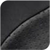
Tejido Alcantara® Gris oscuro