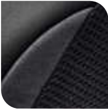
Tejido Malla 3 D X Ray Alcantara® Gris oscuro