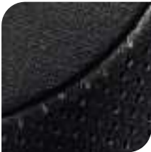
Terciopelo Camcill Gris oscuro