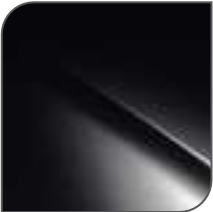
Negro Obsidien Nacarado