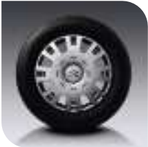
Embellecedores Arromanche 15" X Salvo HDi 110