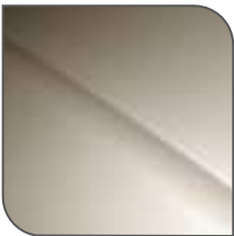
Beige de Langrune Nacarado (5 puertas)