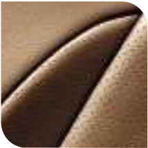
Cuero integral marrón Alezan

El Citroën C4 apuesta por la variedad con una gran surtido de colores en carrocería y tapicerías. Todas las posibilidades para que cada uno pueda elegir según sus deseos.