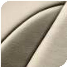
Cuero Wadibis beige