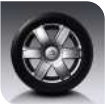
Llantas Aluminio Radicale 16" Opción Collection Serie Collection HDi 138