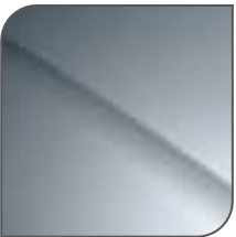
Gris Iceland Metalizado