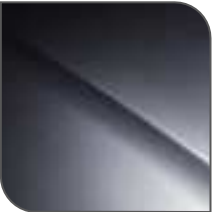
Gris Fer Nacarado