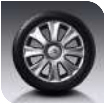
Llantas Aluminio Toka-Toka 17" Serie Exclusive