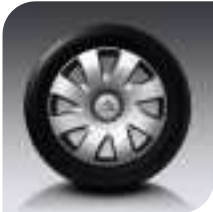
Embellecedores Azzana 16" X HDi 110 y Collection Salvo HDi 138