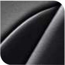
Cuero Gris oscuro