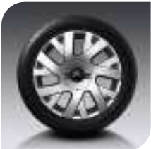
Llantas Aluminio Resolfen 17" Serie VTR Plus-VTS