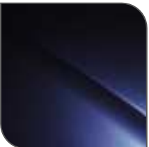
Azul Oriental Nacarado