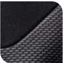
Tejido Mixi Gris oscuro