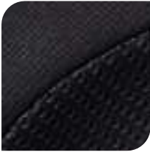
Tejido Malla 3 D X Ray Gris