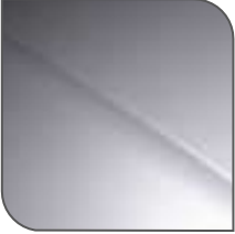
Gris Aluminio Metalizado