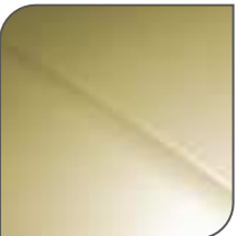
Amarillo Scott Metalizado (Coupé)