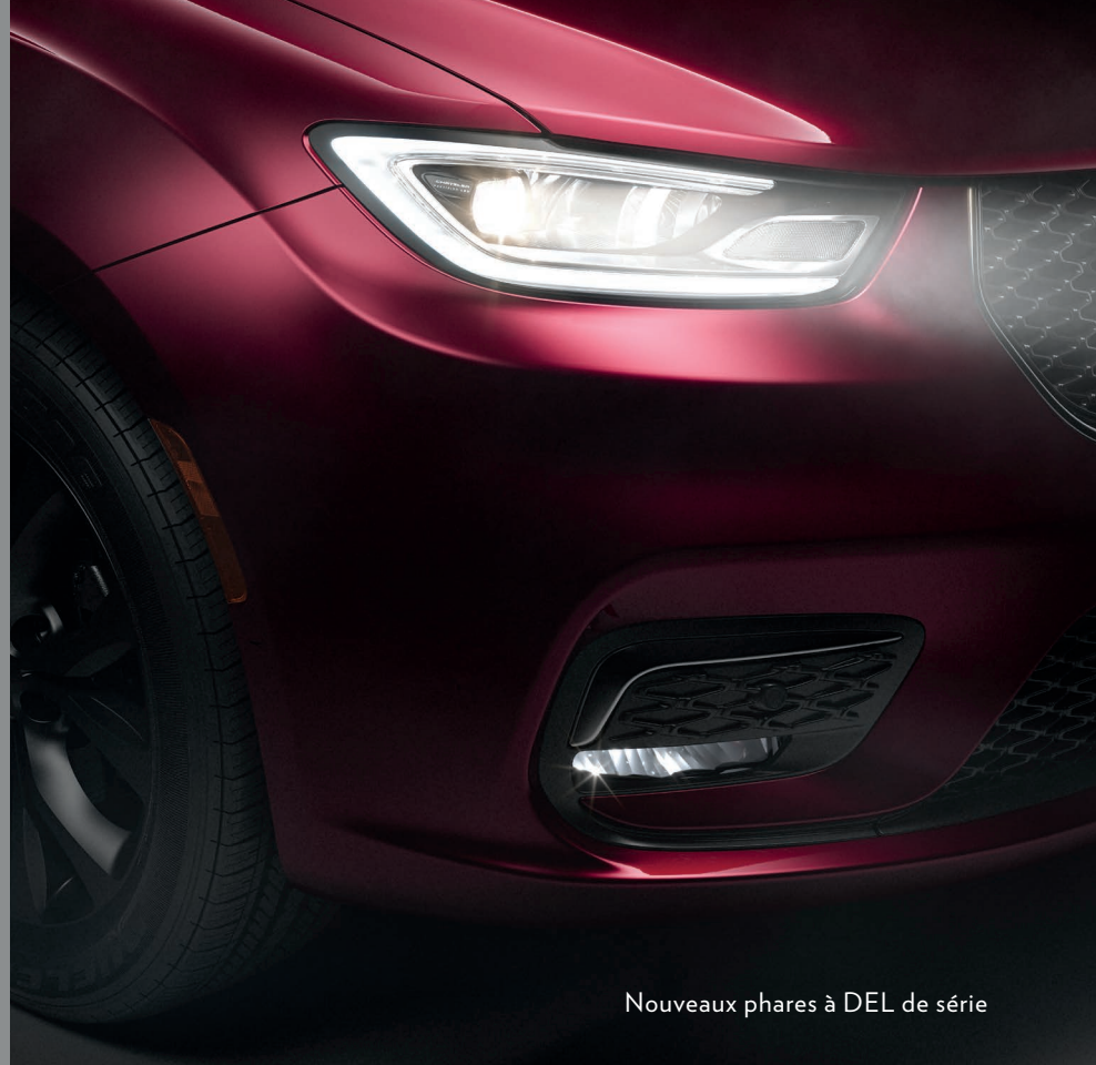
Nouveaux phares à DEL de série

* Remarque à propos de la présente brochure : toutes les divulgations figurent sur la couverture arrière.