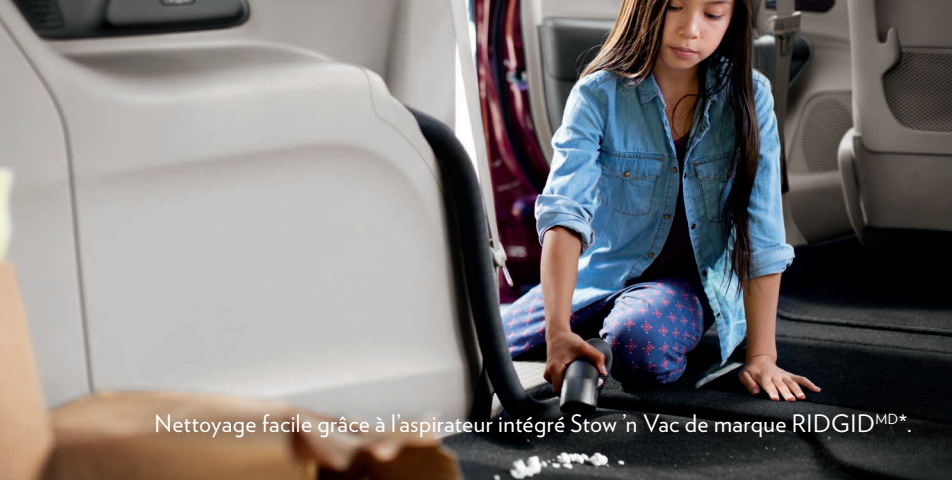
Nettoyage facile grâce à l'aspirateur intégré Stow 'n Vac de marque RIDGID MD *