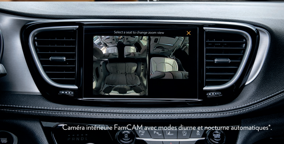
Caméra intérieure FamCAM avec modes diurne et nocturne automatiques*.