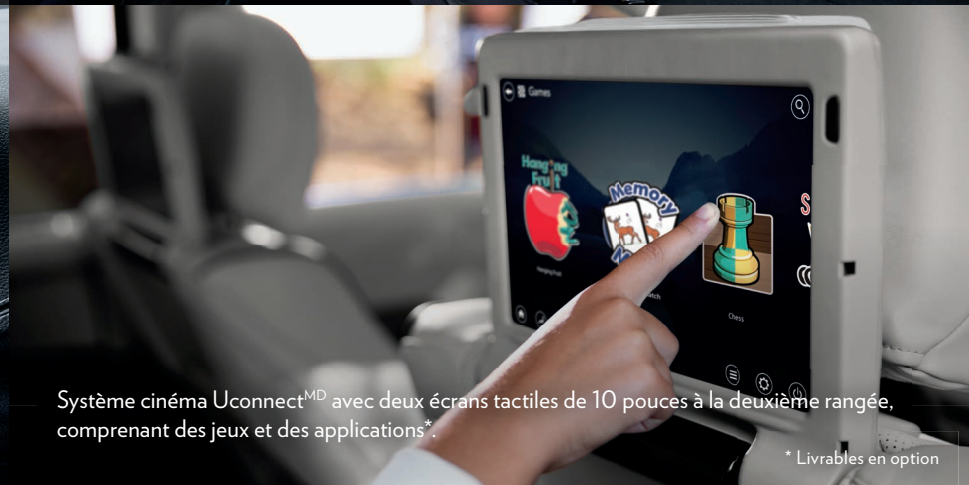
Système cinéma Uconnect MD avec deux écrans tactiles de 10 pouces à la deuxième rangée, comprenant des jeux et des applications*.