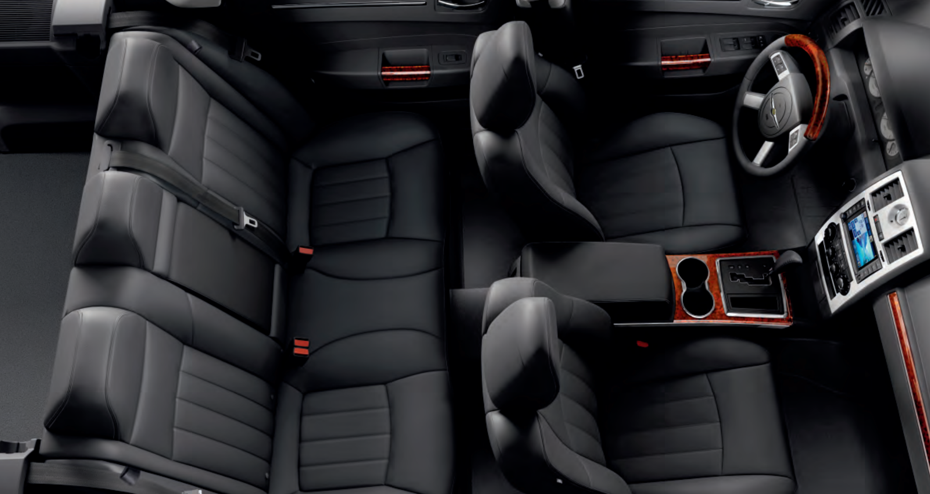
Interior del 300C Touring con tapicería de Cuero Royal Gris Piedra

El interior del 300C Touring, aquí mostrado con detalles símil Carey, es reconfortante, inmenso y sofisticado. El Sistema de Memoria controla los retrovisores exteriores, los ajustes de la radio, el asiento del conductor, el volante y los opcionales pedales regulables eléctricamente. La opcional tapicería de cuero Royal se complementa con los asientos delanteros y traseros calefactables para añadir calidez en toda la extensión de la palabra. El conductor y el acompañante disfrutan del confort que proporcionan los asientos delanteros, regulables eléctricamente en 8 direcciones y el climatizador de doble zona. Las plazas traseras ofrecen un espacio que alguien podría calificar como excesivo. Y si cree que la vida no puede ser más fácil, accione el sistema de puesta en marcha Tip Start, incluido de serie, que apenas requiere girar la llave para tomar la iniciativa.