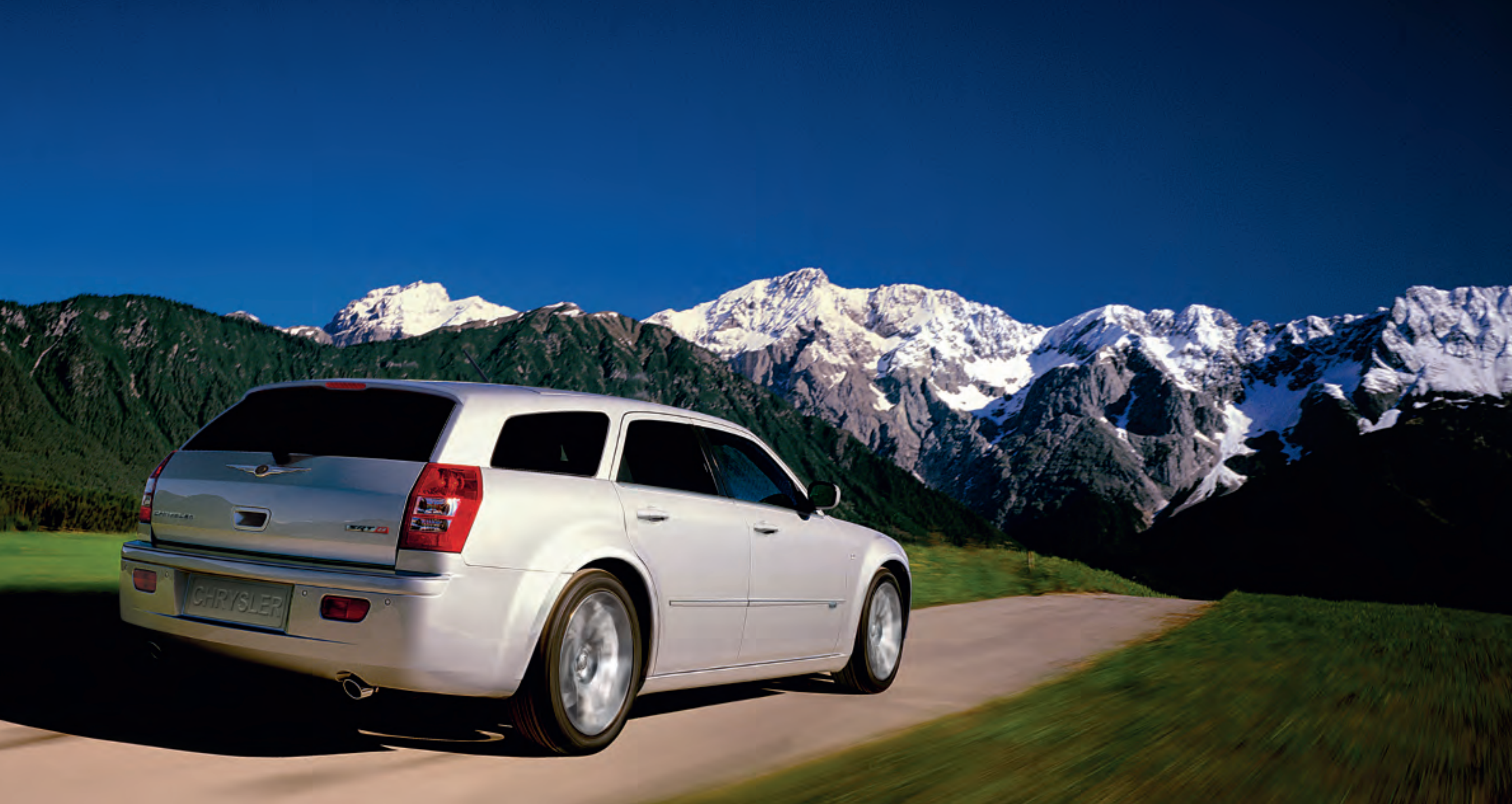
300C Touring SRT8 en color Gris Plata Metalizado

Contemplado desde atrás, la inclinada línea del techo, la doble salida de escape cromada y las imponentes proporciones del Touring SRT8 realmente impresionan. Lateralmente, la elevada línea de cintura crea una silueta poderosa y a la vez ágil. Las pinzas de freno Brembo® con cuatro pistones, el reglaje deportivo de la suspensión autonivelante y las impresionantes llantas de 20" de aluminio forjado aseguran la respuesta propia de un vehículo desarrollado por el departamento Street and Racing Technology (SRT) de Chrysler. Sin duda este nivel de potencia resulta único en un station-wagon. Pero unir tan altas prestaciones a un control y dominio tan placenteros raya en lo excepcional.