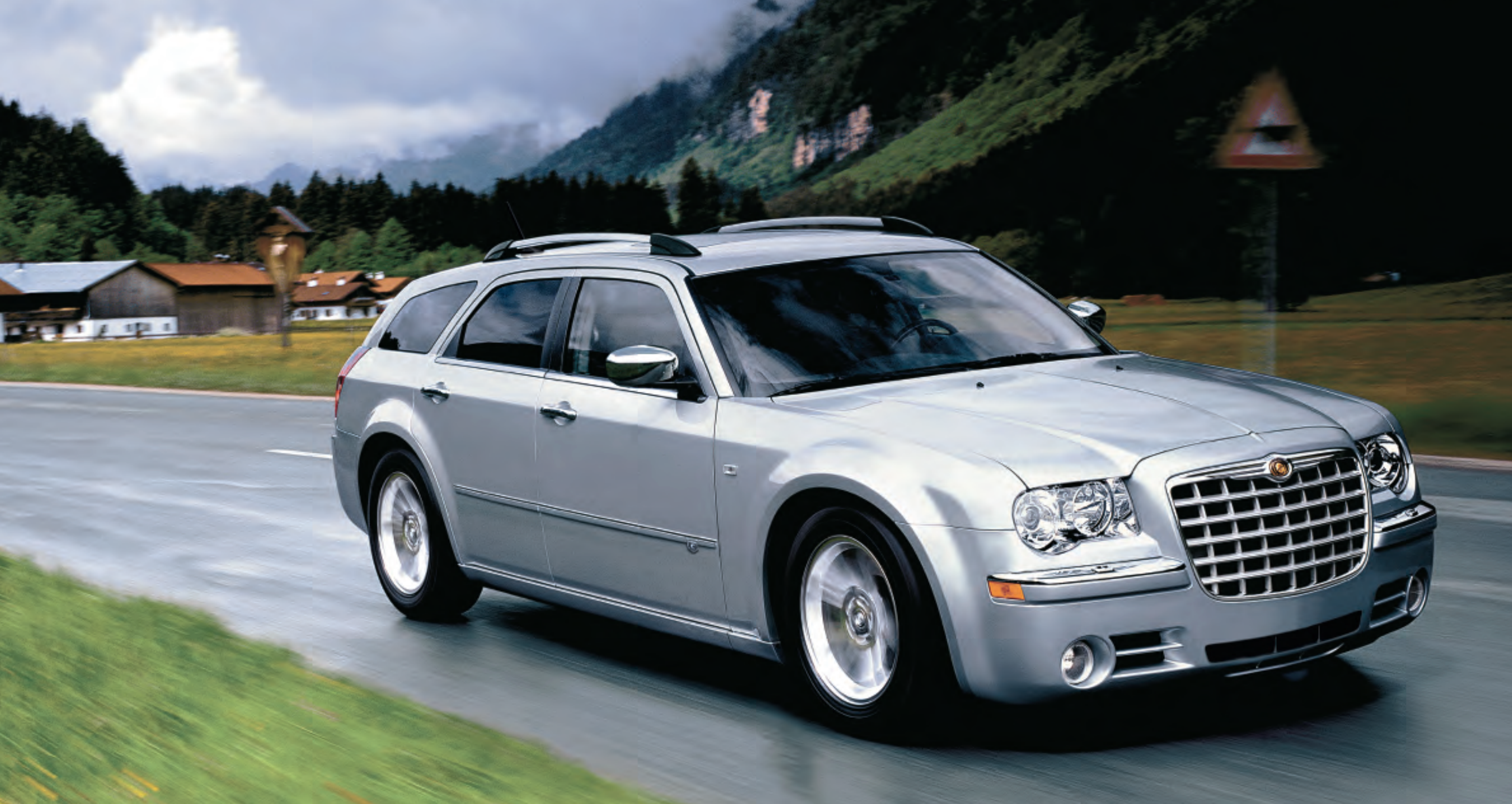
300C Touring en color Gris Plata Metalizado

El 300C Touring destaca en cualquier carretera con su imponente pose, su larga distancia entre ejes y su equilibrada conducción. La parrilla adornada con el emblema alado de Chrysler anuncia la llegada de un vehículo tan único como seductor. La elevada posición de los asientos permite disfrutar de una visión de pleno dominio. Los estilizados y efectivos faros Xenon de Descarga de Alta Intensidad (HID) duplican la luminosidad de los faros convencionales. La disponible tracción AWD a las cuatro ruedas ofrece insuperable adherencia en condiciones desfavorables, (con motor 3.5 v6).