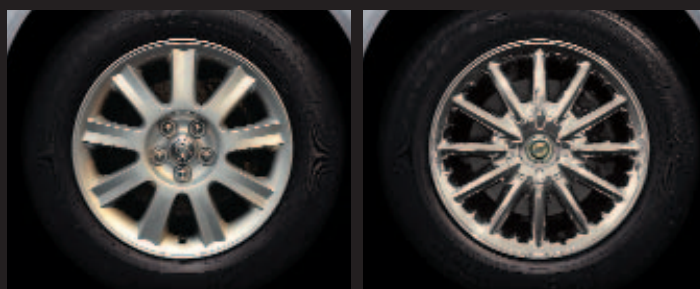
Llantas de Aluminio Lacado de 16" Diseño Bladerunner