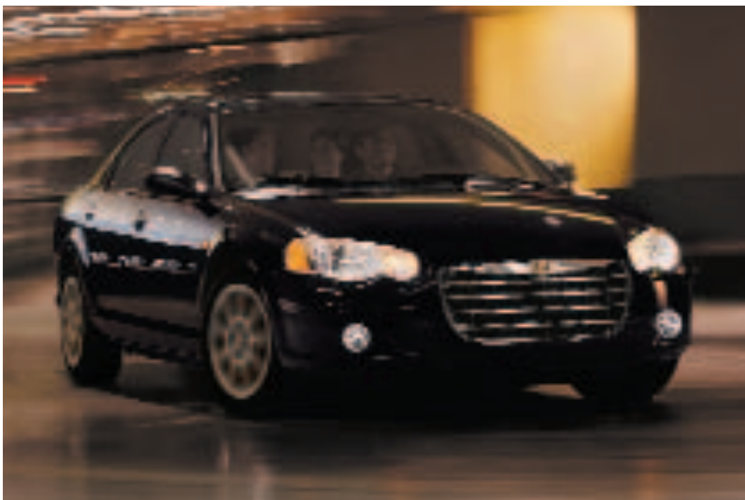
Sebring Sedan en color Negro Metalizado

Descubra el Chrysler Sebring Sedan, un vehículo tan elegante como excepcionalmente equipado. Su interior con cinco amplias plazas ofrece más espacio para las piernas que la mayoría de los turismos de su clase. El asiento trasero abatible en 60/40 y el maletero de 453 litros aportan gran versatilidad de carga. Para responder con precisión a su deseo de prestaciones, el Sebring Sedan le propone dos eficaces motores con potencias de 141 a 203 CV.