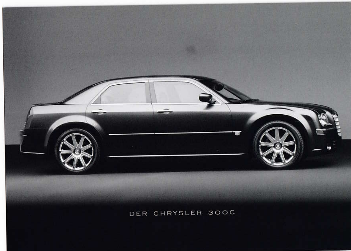
DER CHRYSLER 300C

Chrysler Deutschland GmbH. Chrysler ist eine eingetragene Marke von DaimlerChrysler. Gedruckt in Deutschland 08/2003 • www.chrysler.de