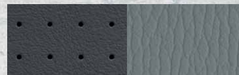
Pelle bicolore Light Slate Gray con inserti traforati Dark Slate Gray