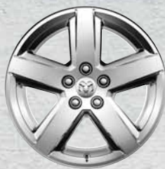
Cerchi da 18" in lega di alluminio disponibili con pacchetto Sport Appearance Group