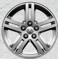
Cerchi da 17" in lega di alluminio di serie

I cerchi disponibili su Dodge Avenger SXT sono stati progettati per aggiungere grinta e design alla vettura.