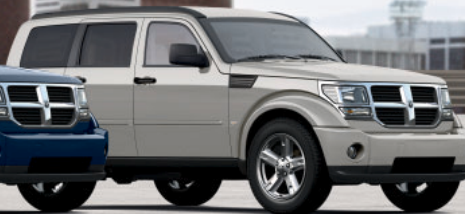
LIGHT GRAYSTONE PEARL