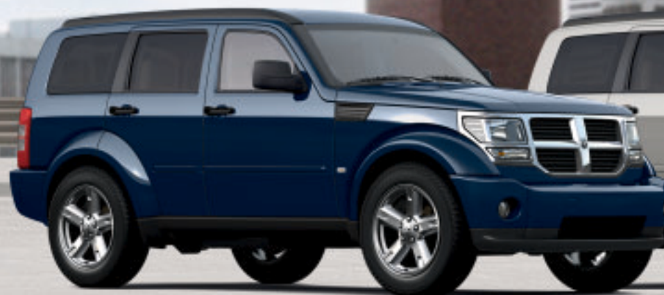
MODERN BLUE PEARL