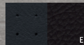
E Pelle Dark Slate Gray con logo R/T