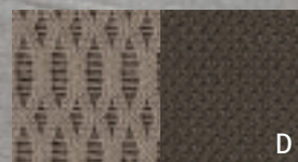
D Tessuto YES Essentials® bicolore Dark/Medium Khaki