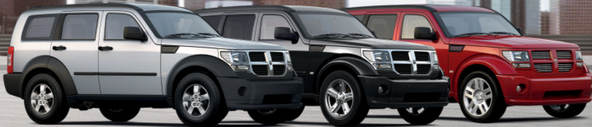
DODGE NITRO SE IN BRIGHT SILVER METALLIC