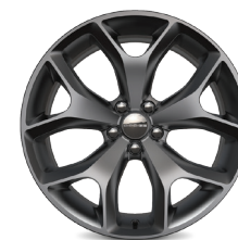
// DUAL STRIPES // DE ALUMINIO FORJADO HYPERBLACK DE 20"