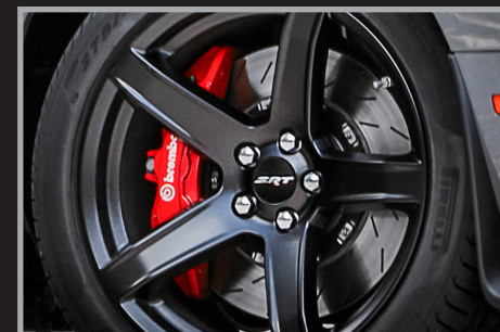
Frenos Brembo® de alto rendimiento con calipers de 6 pistones en color rojo