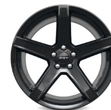
// SRT® HELLCAT // DE ALUMINIO FORJADO MATTE BLACK DE 20"