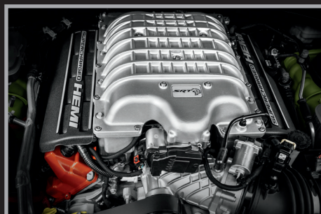
Motor HEMI® Hellcat 6.2L V8 supercargado con 707 C.F. (Versión Hellcat)