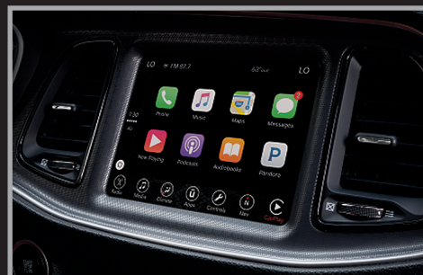
Sistema Uconnect® 8.4" con Apple CarPlay® y Google Android Auto®