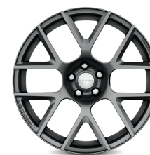
// SCAT PACK // DE ALUMINIO FORJADO DE 20"