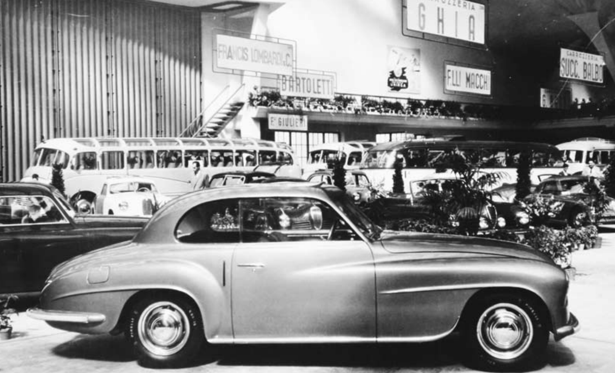
Ferrari 166 Inter (1948)