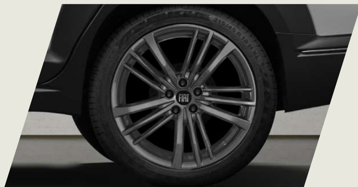
LLANTAS DE ALEACIÓN DE 17", TAMAÑO 6, COLOR EXCLUSIVO

Acercate a un concesionario y conocé la gama de accesorios originales que Mopar te ofrece para equipar tu FIAT Fastback, seguido de las imágenes de cada accesorio.