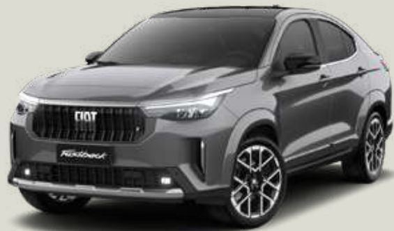
175 | GRIS SILVERSTONE + NEGRO VULCANO