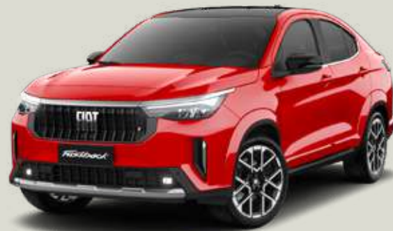
663 | ROJO MONTECARLO + NEGRO VULCANO