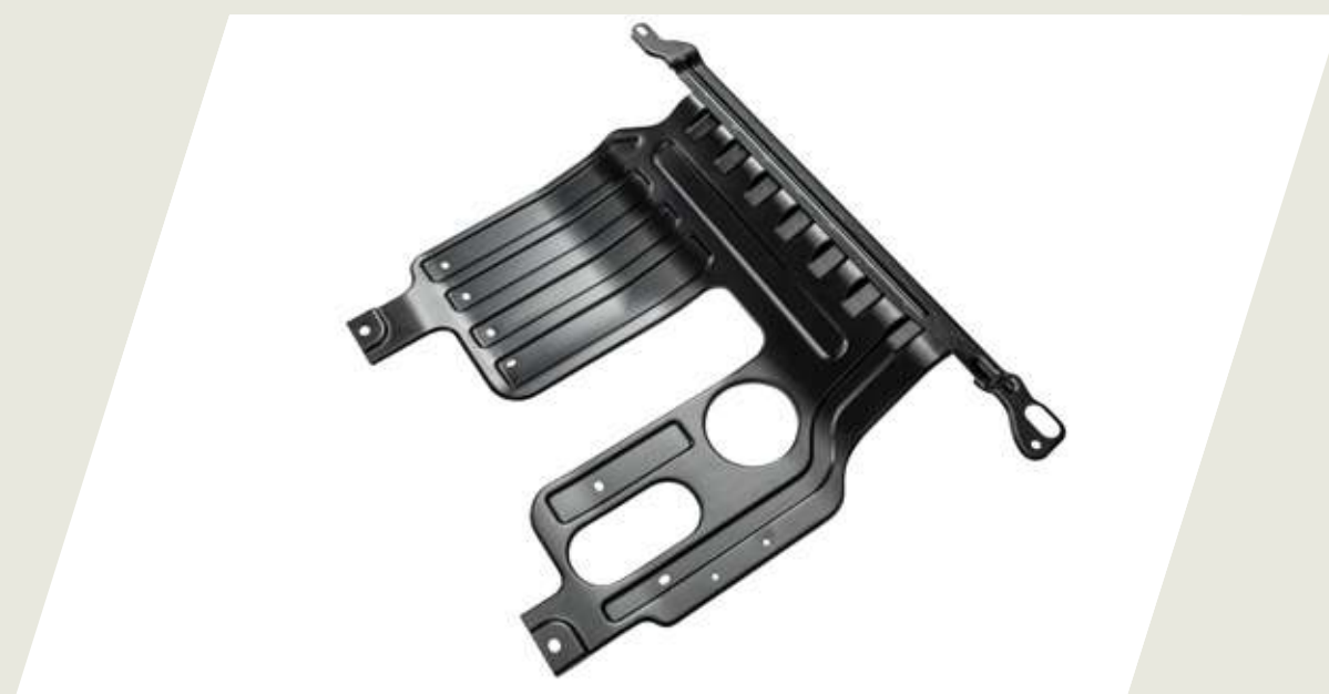
PROTECTOR DE CARTER