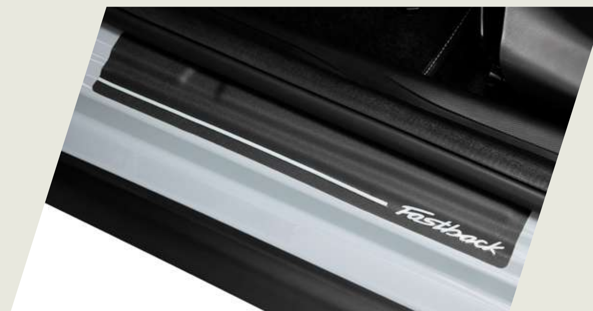
PROTECTOR DE ZÓCALO - VINILO