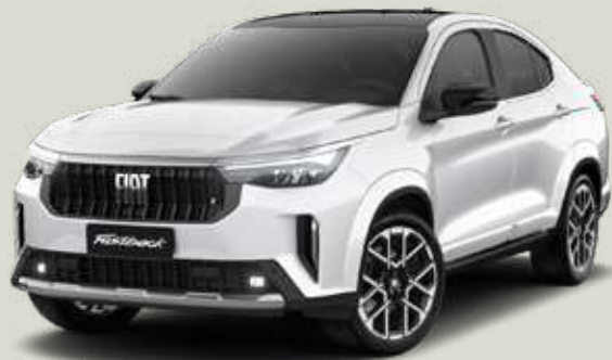
743 | BLANCO BANCHISA + NEGRO VULCANO