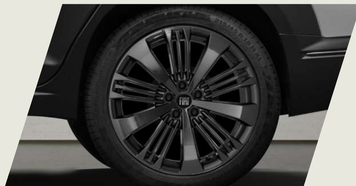
LLANTAS DE ALEACIÓN DE 17", TAMAÑO 7, COLOR EXCLUSIVO