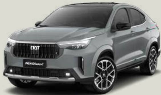
766 | GRIS STRATO + NEGRO VULCANO