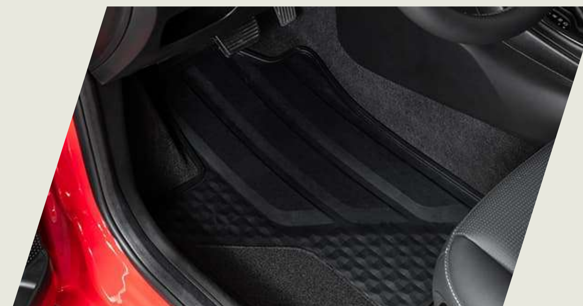
CUBRE ALFOMBRA TEXTIL CON GOMA