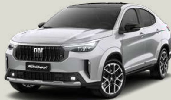
832 | PLATA BARI + NEGRO VULCANO