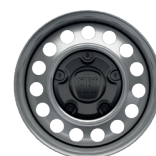
JANTES TÔLE GRISE 15"