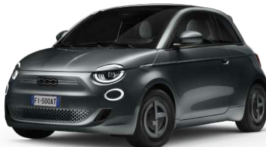
COLOR VERDE 0€