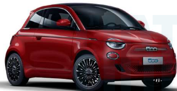
ROJO PASSIONE 500€