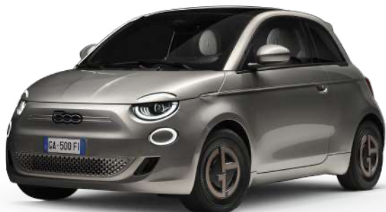
COLOR GREIGGE 0€