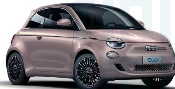
ROSA GOLD 500€