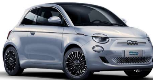
AZUL CELESTIAL 500€