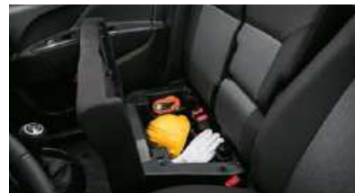
Compartiment sous le siège côté passager (selon version)