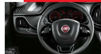
Commandes au volant.