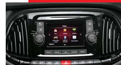
Écran tactile 5" + Bluetooth