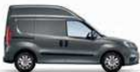
Avec 1 porte latérale coulissante

▲ Autoradio MP3 écran tactile 5" Bluetooth Connectivité USB/AUX Commandes radio au volant