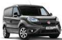
Gris foncé (615)