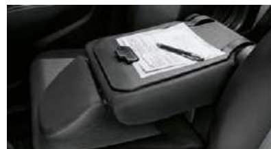
Dossier du siège central rabattable. (selon version)