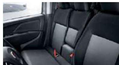
Troisième place dans la cabine. (selon version)

Un lieu de travail encore plus fonctionnel et plus confortable et des performances renforcées : le nouveau Doblò Cargo a été pensé pour être votre allié. Avec sa gamme vaste et polyvalente, il y aura forcément un nouveau Doblò Cargo pour répondre à toutes les exigences de votre métier. Le nouveau Doblò Cargo c'est : plus de fonctionnalités, plus de performances, plus de rentabilité.