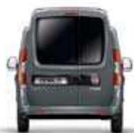
Avec 2 battants vitrés