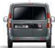
Avec 2 battants vitrés