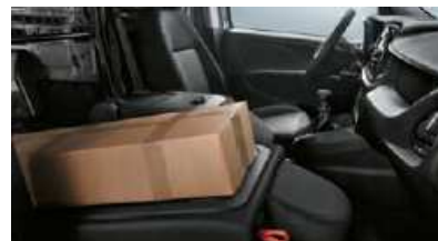
Dossier du siège passager rabattable.