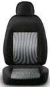
Rayé gris 275