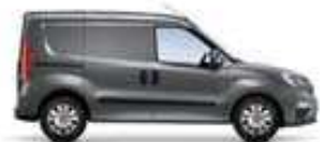
Avec 1 porte latérale coulissante