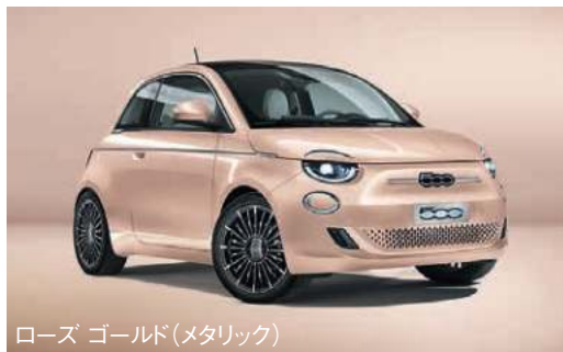
ローズ ゴールド(メタリック)