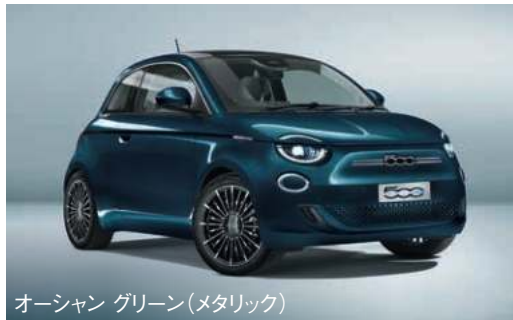
オーシャン グリーン(メタリック)