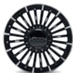
500E ICON / 500E OPEN 17インチ ダイヤモンドカット アルミホイール