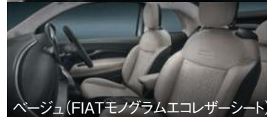
ページュ (FIATモノグラムエコレザーシート)