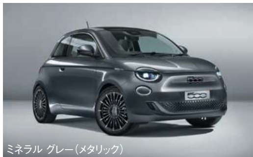
ミネラル グレー(メタリック)