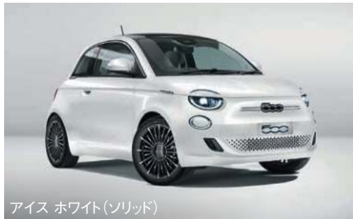
アイス ホワイト(ソリッド)