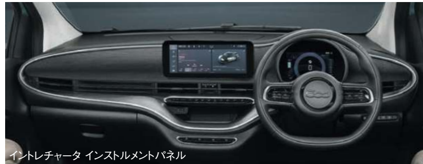
イントレチャータ インストルメントパネル