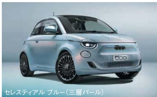
セレスティアル ブルー(三層パール)