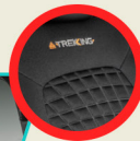
Logo bordado y costuras amarillas