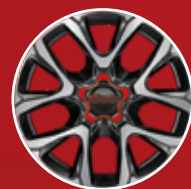
19"-Leichtmetallfelgen mit rotem „500“ Logo an den Radkappen