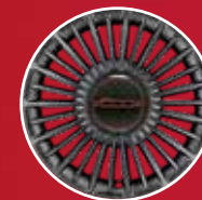
16"-Leichtmetallfelgen 12 Doppelspeichen mit rotem „500“ Logo an den Radkappen