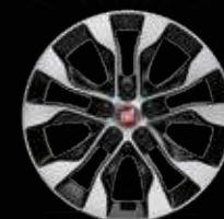
Llantas estilizadas con embellecedores de 41cm (16")