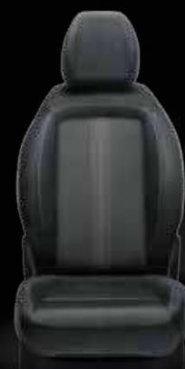
Tejido Skyline negro/gris con costuras dobles