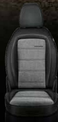
Tejido jaspeado con apliques en vinilo y costuras dobles