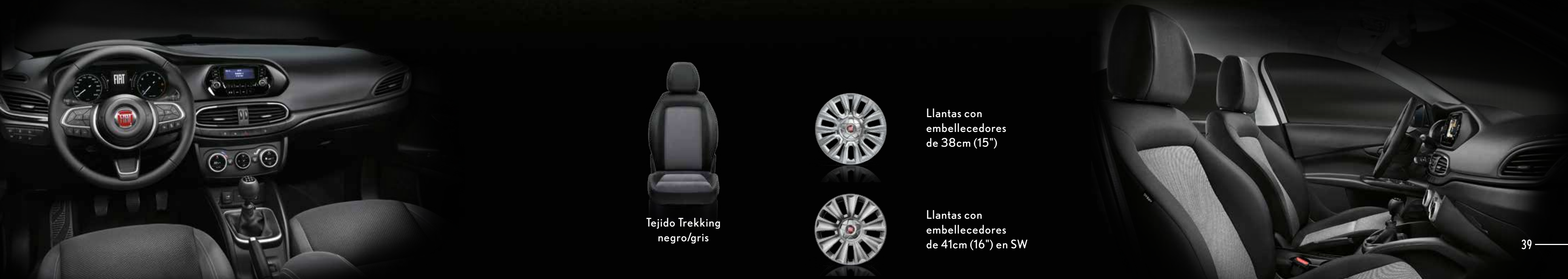
Tejido Trekking negro/gris