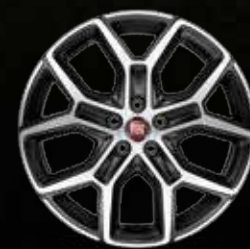
Llantas de aleación de 43cm (17") diamantadas en negro mate