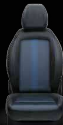
Tejido Skyline negro/azul con costuras dobles