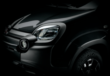
601 CINEMA SCHWARZ