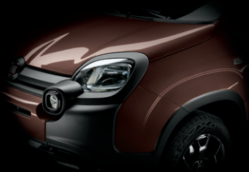
585 NEU: CAFFÈ BRAUN METALLIC