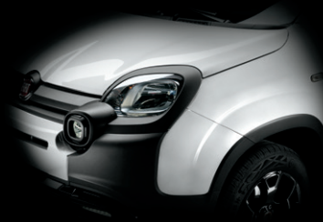
296 GELATO WEISS