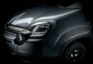
581 COLOSSEO GRAU