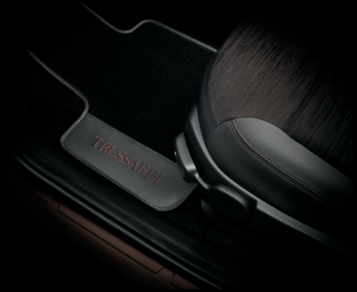
FUSSMATTEN VORNE MIT TRUSSARDI-LOGO