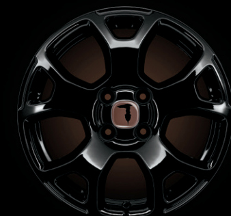
15"-LEICHTMETALLFELGEN IN SCHWARZ