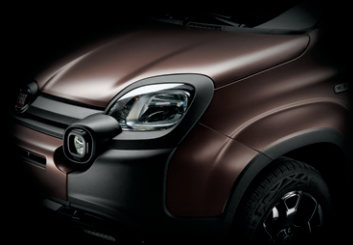
586 NEU: CAFFÈ BRAUN MATT