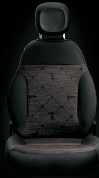
STOFFSITZE MIT EINSÄTZEN AUS TECHNO-LEDER*