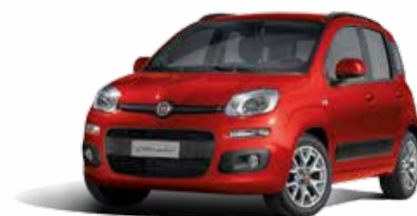
078 ROSSO AMORE PASTELLO