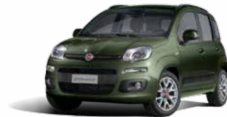
374 VERDE TOSCANA METALLIZZATO