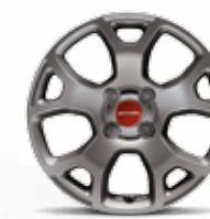
Cerchi in lega 15" bruniti opachi di serie su Panda Cross 4x4 e opt. a richiesta su Panda City Cross (opt. 108)