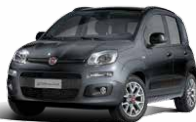
446 GRIGIO COLOSSEO METALLIZZATO