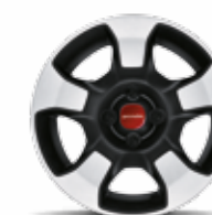
Cerchi in acciaio 15" e cover ruota estetica di serie su Panda City Cross