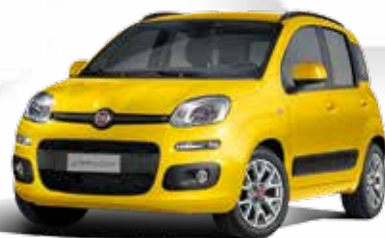
509 GIALLO SOLE PASTELLO