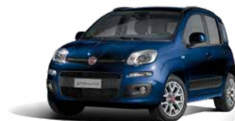
567 BLU MEDITERRANEO MICALIZZATO