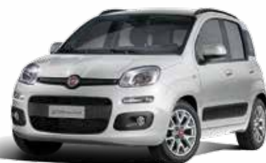
565 GRIGIO ARGENTO METALLIZZATO