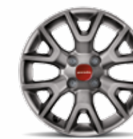
Cerchi in lega 15" bruniti opt. a richiesta su Panda 4x4 (opt. 420)