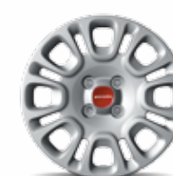
Cover ruota 14" di serie su Panda Easy