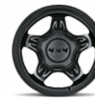
Cerchi in acciaio nero 15" con cover mozzo dedicato di serie su Panda 4x4