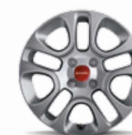
Cerchi in lega 14" di serie su Panda Lounge (opt. 439)