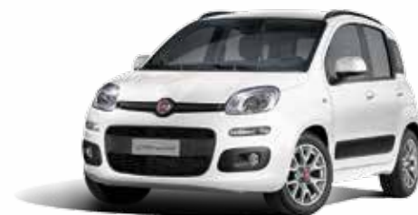
296 BIANCO GELATO PASTELLO