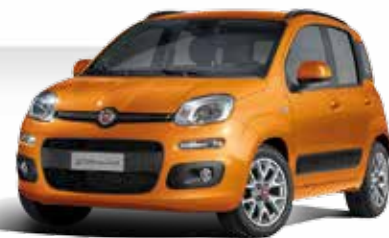
516 ARANCIO SICILIA PASTELLO