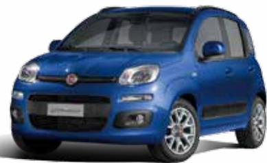
789 BLU GIOTTO PASTELLO