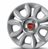
Cover ruota 15" di serie su Panda Easy motorizzazione metano