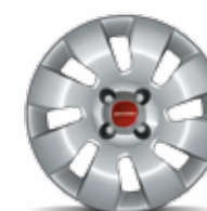
Cover ruota 14" di serie su Panda Pop