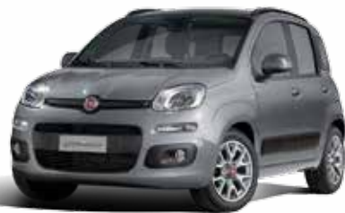
785 GRIGIO MODA PASTELLO