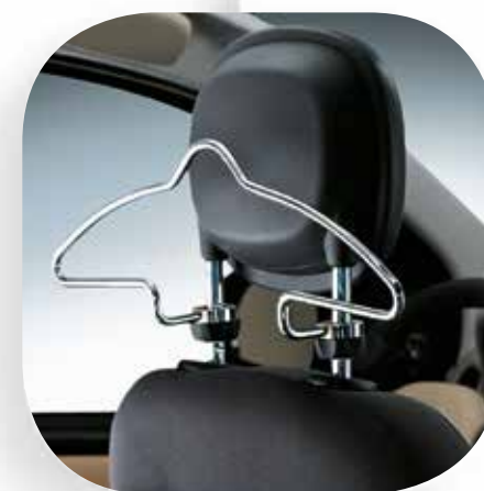
Appendigiacca su poggiatesta