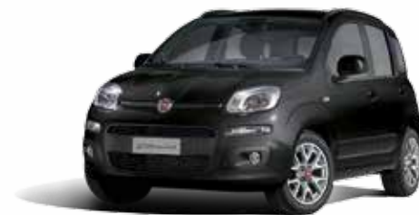
601 NERO CINEMA PASTELLO