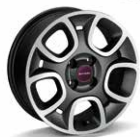
Cerchi in lega 15" colore grigio antracite/diamantato