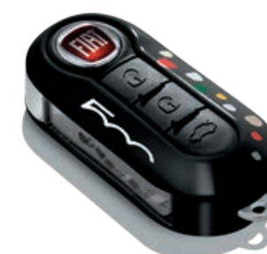
Singolo, nero con punti colorati