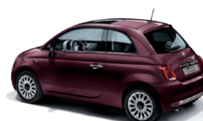
866 OPERA BORDEAUX