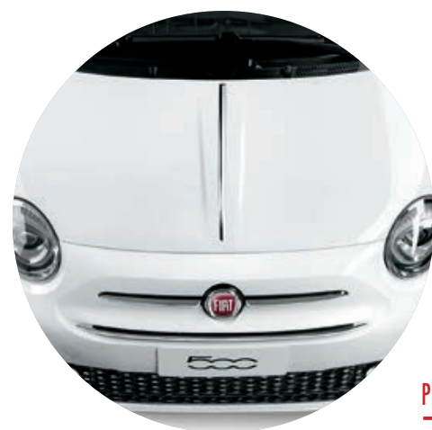
PROFILO CROMATO SUL COFANO