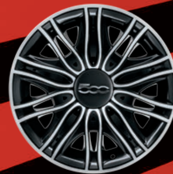
CERCHIO IN ACCIAIO 15" STYLED (opt. POP)