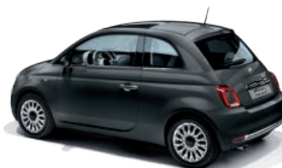
735 GRIGIO CARRARA