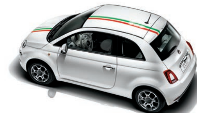
STICKER FASCIA 500 ITALIA

Fascia per cofano e tetto. Compatibile con la versione tetto in vetro.