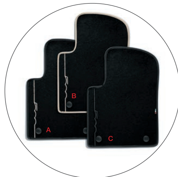
TAPPETINI NERI - A

Set di 4 tappetini con profilo nero, logo 500 avorio e bandiera italiana.