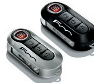
Set di 2 cover, in grigio chiaro e nero.