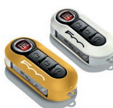
Set di 2 cover, in arancione e bianco pastello.