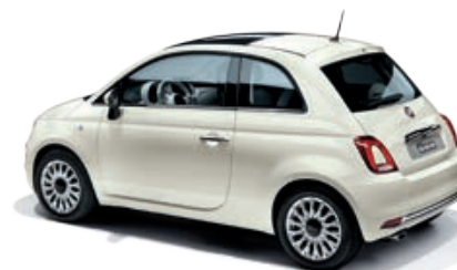
227 BIANCO GHIACCIO