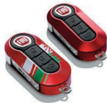
Set di 2 cover rosse, di cui una con grafi ca stilizzata bandiera italiana.