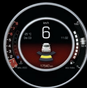
REAR PARK ASSIST

Solo 500, a richiesta, ti offre la possibilità di usufruire di un quadro strumenti con display digitale TFT da 7" , sviluppato da Magneti Marelli. Uno strumento con informazioni utili per la tua guida, sempre in tempo reale. Non solo: il tutto è perfettamente integrato con Uconnect™ Radio LIVE DAB e Uconnect™ 7" LIVE , che ti permetteranno di consultare tramite lo stesso schermo anche le informazioni relative alle funzioni Media, per telefono e connettività, e le informazioni di Navigazione.