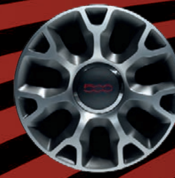
CERCHI IN LEGA 16" diamantato (ROCKSTAR)