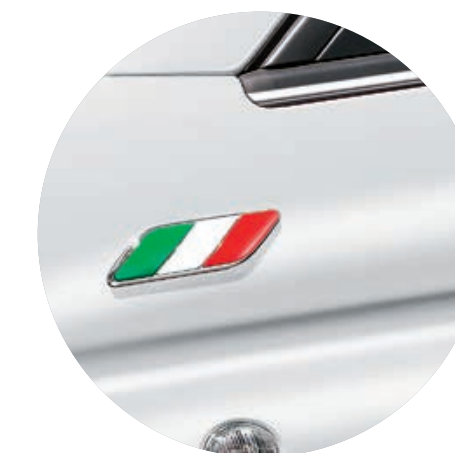
BADGE "BANDIERA ITALIANA" SU PARAFANGO

Fascia per cofano e tetto. Disponibile con tetto in lamiera.