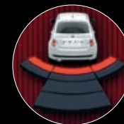
REAR PARK ASSIST

Anche la visualizzazione di Rear Park Assist sarà personalizzata secondo il tuo modello di 500, mentre con la funzione TPMS potrai controllare la pressione degli pneumatici, quando preferisci.