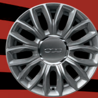
CERCHI IN LEGA 15" argento lucido (opt. LOUNGE)