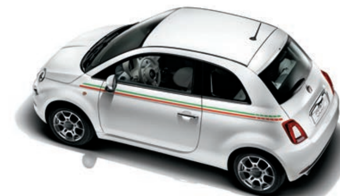
FASCIA LATERALE ITALIA

Sticker su fronte, porta e posteriore laterale.