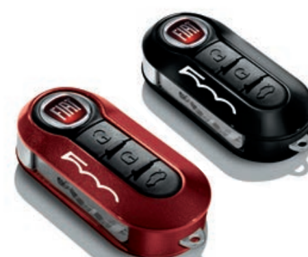
Set di 2 cover, in rosso metallizzato e nero pastello.