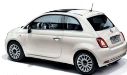
268 BIANCO GELATO