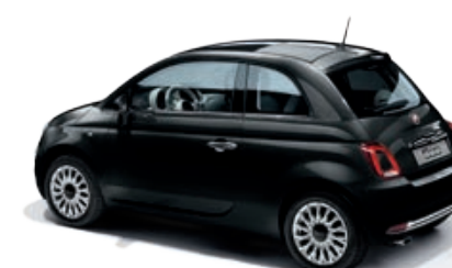
876 NERO VESUVIO