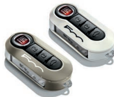
Set di 2 cover, in beige bianco pastello.