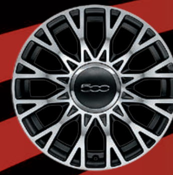
CERCHI IN LEGA 16" nero diamantato (opt. STAR)