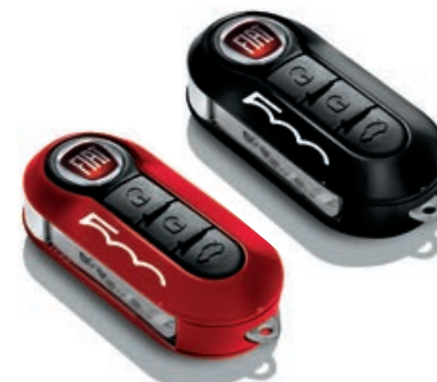
Set di 2 cover, in rosso e nero pastello.