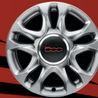
CERCHI IN LEGA 15" argento lucido (SPORT)