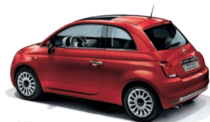
111 ROSSO PASSIONE