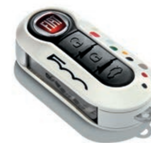
Singolo, bianco con punti colorati