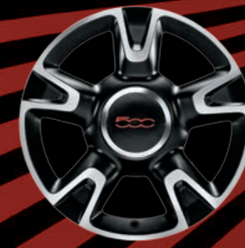
CERCHI IN LEGA 16" nero opaco diamantato (opt. ROCKSTAR)