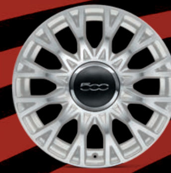
CERCHI IN LEGA 16" bianco diamantato (opt. STAR)