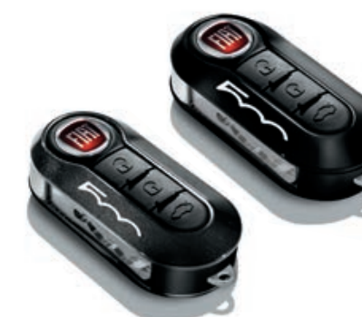
Set of 2 cover, in grigio scuro e nero pastello.