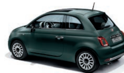
421 - DISPONIBILE SOLO SU ROCKSTAR VERDE PORTOFINO