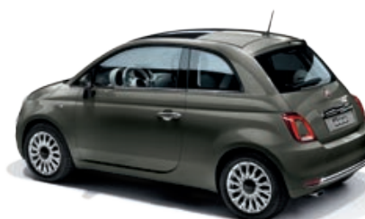
372 GRIGIO COLOSSEO