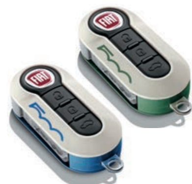
Set di 2 cover, bianco/blu Italia e bianco/verde militare.