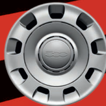
COPPA RUOTA 14" GRIGIO (POP)