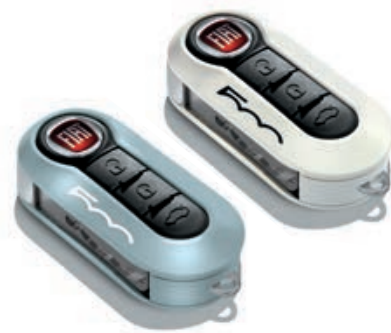
Set di 2 cover, in azzurro e bianco pastello.