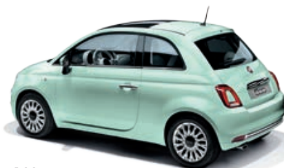
166 VERDE LATTEMENTA