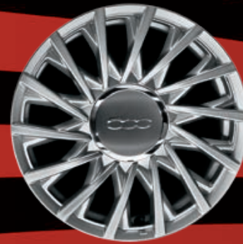
CERCHI IN LEGA 15" argento lucido (LOUNGE)

Come dimostra l'ampia scelta di cerchi in lega per completare e personalizzare un'auto che sa bene che non è necessario cercare la perfezione quando può essere già raggiunta. E superata.