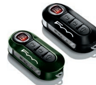
Set di 2 cover, in verde britihs e nero pastello.