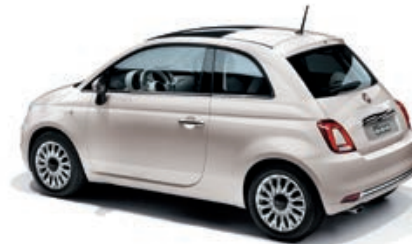
494 - DISPONIBILE SOLO SU STAR BIANCO STELLA