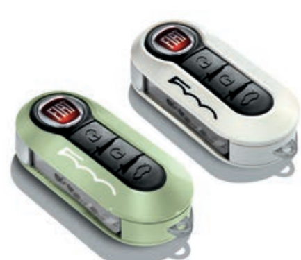
Set di 2 cover, in verde chiaro e bianco pastello.