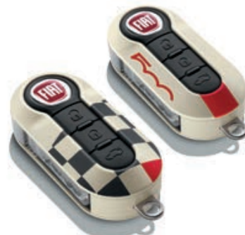
Set di 2 cover, con bandiera a scacchi e logo 500.