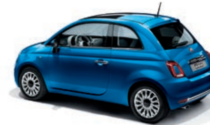
425 AZZURRO ITALIA