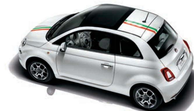
FASCIA 500 ITALIA

Sticker su fronte, porta e posteriore laterale.