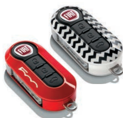
Set di 2 cover, rosso corallo e fantasia chevron.