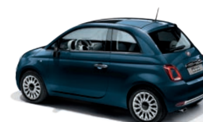
687 BLU DIPINTO DI BLU