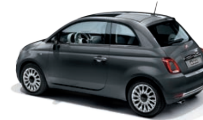
695 GRIGIO POMPEI