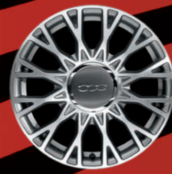
CERCHI IN LEGA 16" argento lucido (STAR)