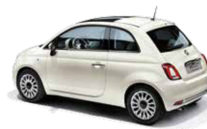
227 ICE WHITE