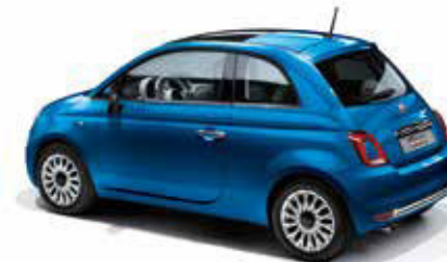
425 ITALIA BLUE