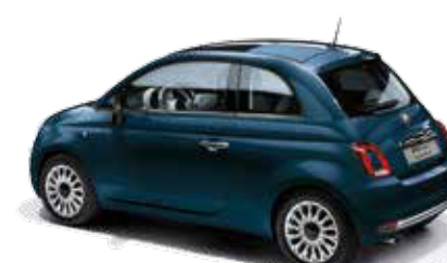
687 EPIC BLUE