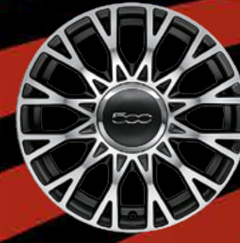
JANTES EN ALLIAGE 16" Spider finition noir laqué (CLUB, opt. STAR)