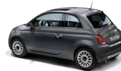
695 ELECTROCLASH GREY