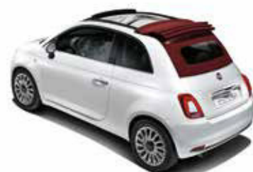
CAPOTE ROUGE MÉTÉORITE