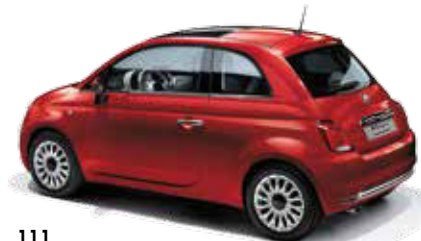
111 PASODOBLE RED