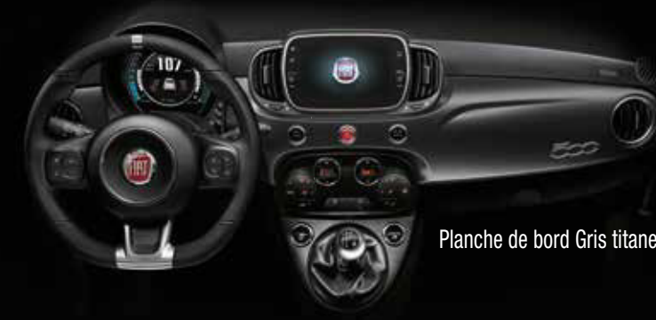
Planche de bord Gris titane.