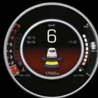
RADAR DE RECUL

Pour cette raison, elle a choisi d'embarquer un écran numérique TFT de 7" . Il sert à contrôler toutes les informations qui peuvent être utiles pendant la conduite ; comme par exemple, les données du tachymètre, du compte-tours, de la température ou de l'indicateur de boîte de vitesses et de l'ordinateur de bord. De plus, le tout permet de consulter, sur le même écran, le lecteur multimédia, le téléphone et le navigateur.