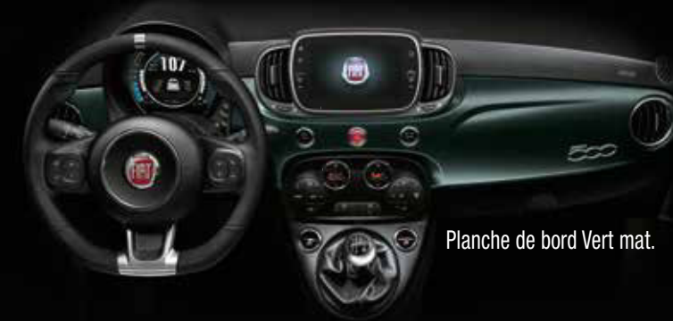
Planche de bord Vert mat.