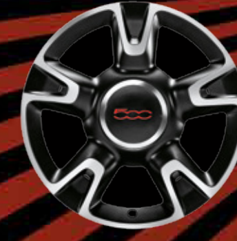
JANTES EN ALLIAGE 16" New Sport (opt. ROCKSTAR)