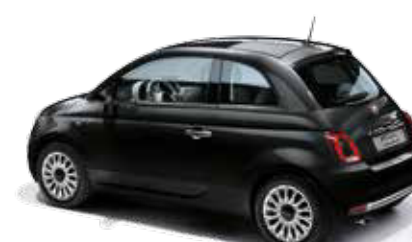
876 CROSSOVER BLACK