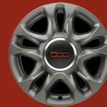
JANTES EN ALLIAGE 15" New Sport finition gris (opt. SPORT)