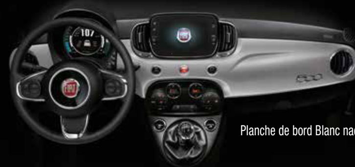
Planche de bord Blanc nacré.