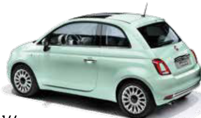
166 MINT GREEN