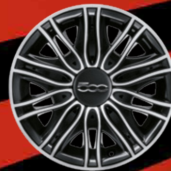
ENJOLIVEURS 15" (opt. POP)