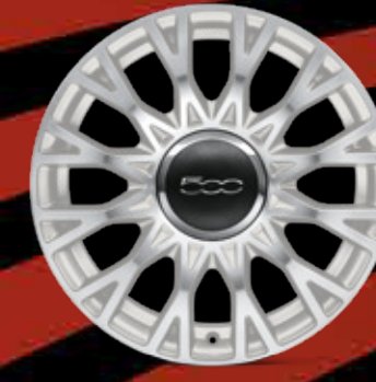
JANTES EN ALLIAGE 16" Spider finition blanc (opt. STAR, opt. CLUB)