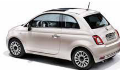
494 POWDER PINK