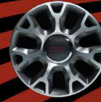
JANTES EN ALLIAGE 16" Sport (ROCKSTAR)