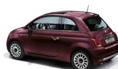
866 OPERA BORDEAUX