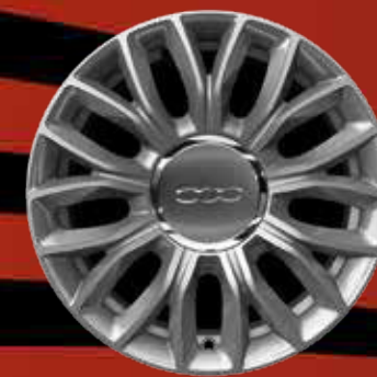
JANTES EN ALLIAGE 15" Lounge (opt. LOUNGE)