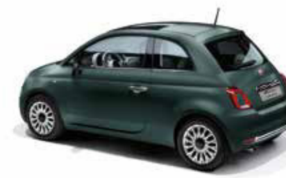
421- EXCLUSIVE VERSION ROCKSTAR MATT GREEN