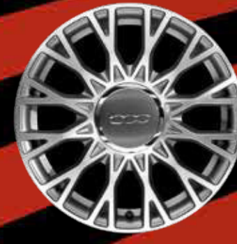
JANTES EN ALLIAGE 16" Spider (STAR)