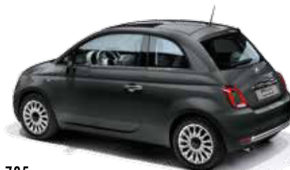
735 TECH-HOUSE GREY