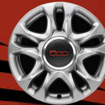
JANTES EN ALLIAGE 15" New Sport finition blanc (SPORT)