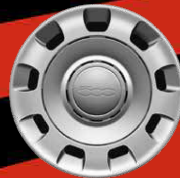
ENJOLIVEURS 14" (POP)