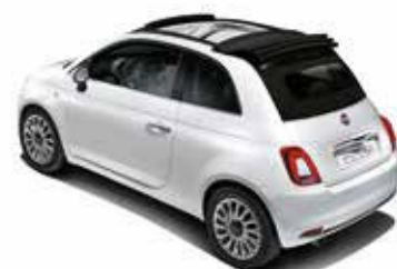
CAPOTE NOIR ÉCLIPSE