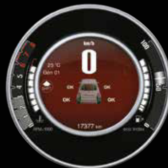
INDICATEURS DE PRESSION DES PNEUMATIQUES