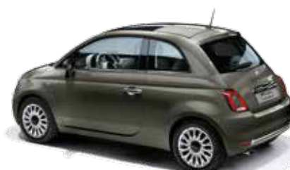
372 GROOVE METAL GREY