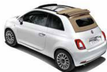
CAPOTE BEIGE LUNAIRE