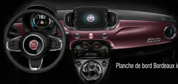
Planche de bord Bordeaux intense.