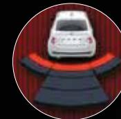
RADAR DE RECUL