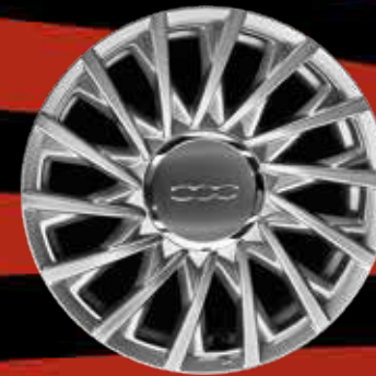
JANTES EN ALLIAGE 15" New Lounge (LOUNGE)

Notre sélection de jantes en alliage vous permet d'apporter votre touche personnelle sur une voiture qui a déjà atteint, voire surpassé la perfection.