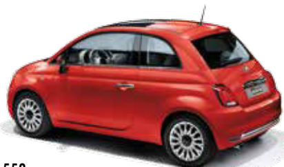
552 CORAL RED