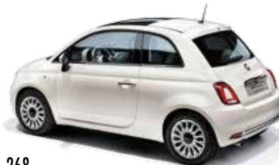
268 BOSSANOVA WHITE