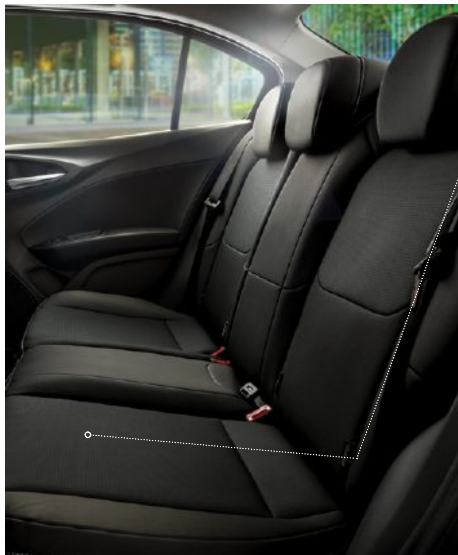
Asientos traseros también ofrecen un óptimo espacio, tanto en altura y cuanto a confort para las piernas.