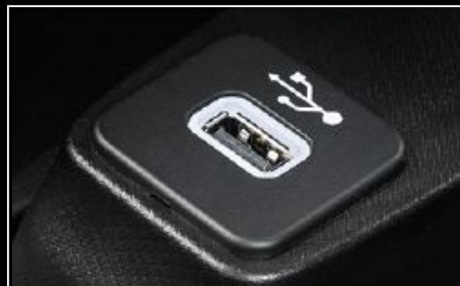
Doble Entrada USB