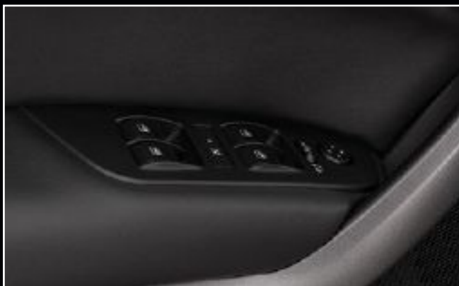
Vidrios eléctricos con un solo toque y antiplastamiento.