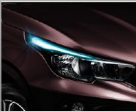
Faroles LED con diseño.