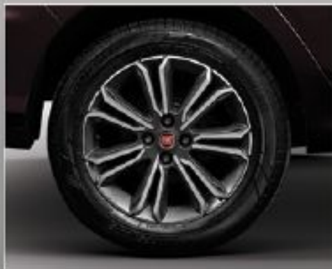
Llantas de liga leve aro 16".