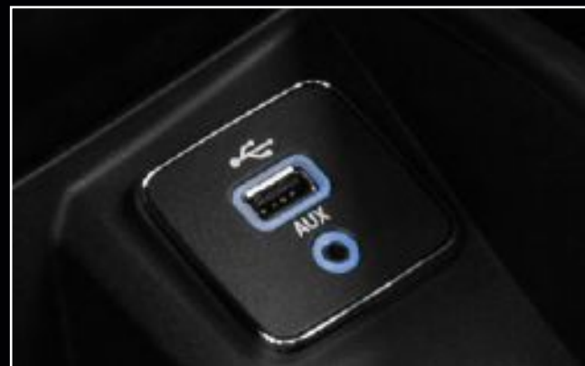
Entrada USB y conexión AUX delanteras.