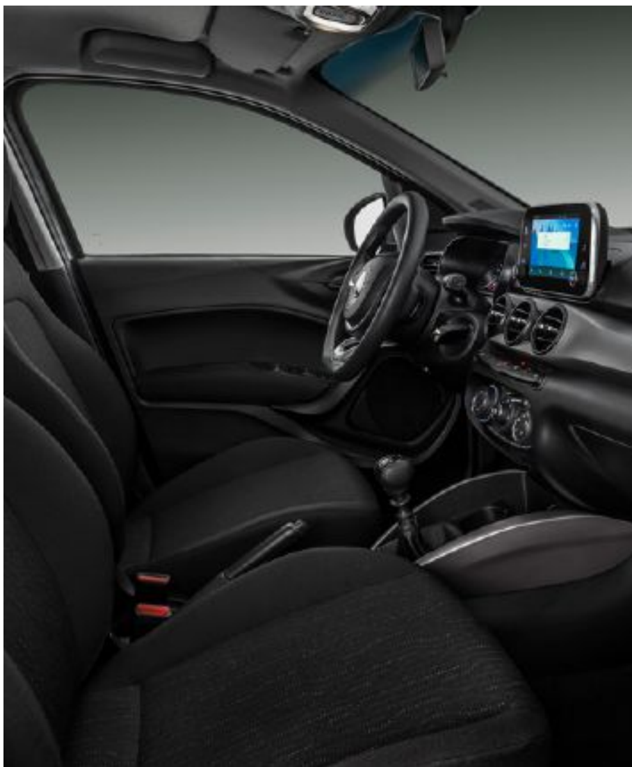
Amplio espacio para las piernas, que permite una posición agradable para conducir y para el pasajero.