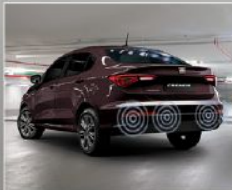
Sensor de Estacionamiento trasero.