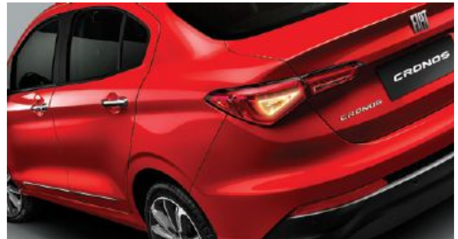
Señalización del freno de emergencia