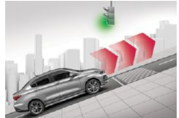
Hill Holder : ayuda en los arranques en subida y en descenso, manteniendo el freno accionado para que el motor tenga fuerza para arranzar. (equipamiento disponible según versión)