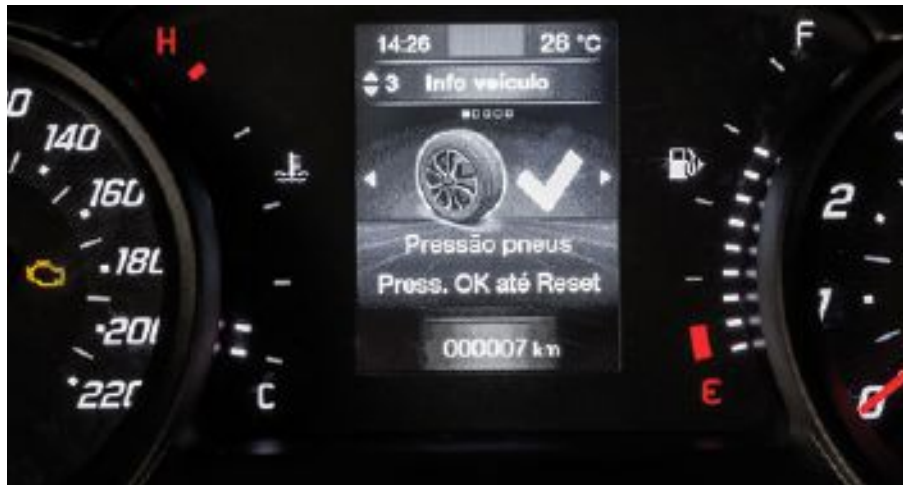
Sistema de monitoreo de presión de neumáticos (iTPMS)