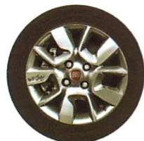
Liga leve 14" (opcional para versão Way)