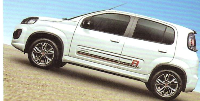
Hill Holder e TC (Controle de Tração)