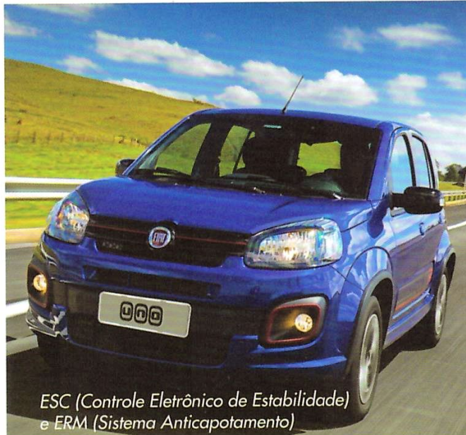
ESC (Controle Eletrônico de Estabilidade) e ERM (Sistema Anticapotamento)