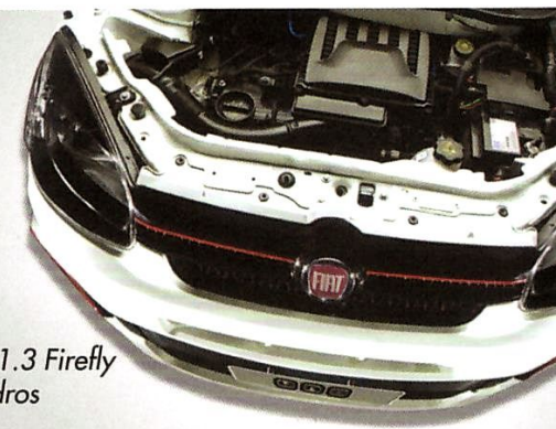
Motor 1.3 Firefly 4 cilindros