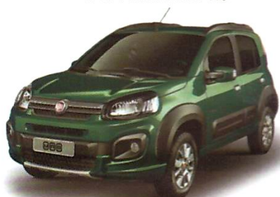
UNO WAY 1.3/ UNO WAY 1.3 DUALOGIC®