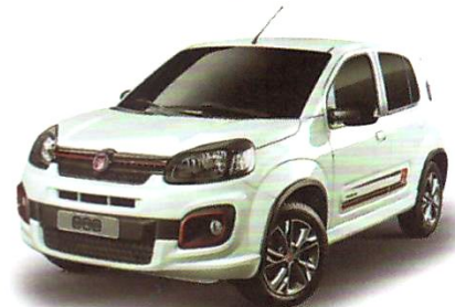
UNO SPORTING 1.3/ UNO SPORTING 1.3 DUALOGIC®