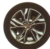
Liga leve 15" (exclusiva para versão Sporting)