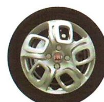
Calota 14" (exclusiva para versão Way)