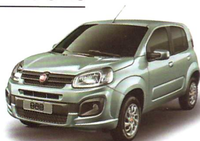
UNO ATTRACTIVE 1.0