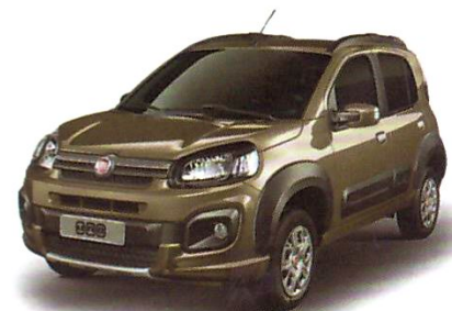
UNO WAY 1.0