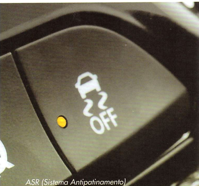
ASR (Sistema Antipatinamento)