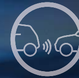
AIDE AU STATIONNEMENT