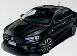
718 NOIR CINEMA MÉTALLISÉ