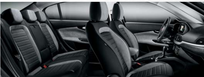
EASY - INTÉRIEUR EN TISSU GRIS CHINÉ BI-TON.