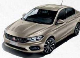
722 PERLE SABBIA MÉTALLISÉ