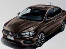
444 BRONZE MAGNETICO MÉTALLISÉ