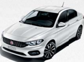
249 BLANC GELATO PASTEL