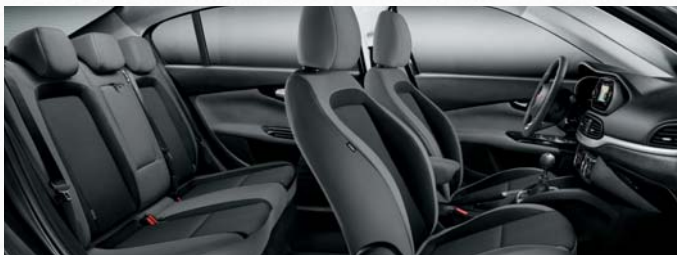
TIPO - INTÉRIEUR EN TISSU STRUCTURÉ NOIR ET GRIS.