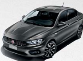
695 GRIS COLOSSEO MÉTALLISÉ