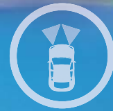
CAPTEUR DE LUMINOSITÉ