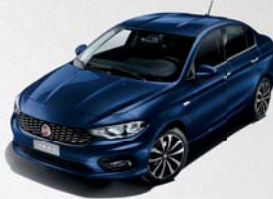
717 BLEU MEDITERRANEO MÉTALLISÉ

Fiat Tipo propose un large choix de coloris.