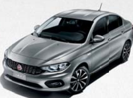
612 GRIS MAESTRO MÉTALLISÉ