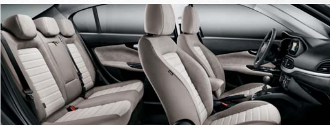
EASY - INTÉRIEUR EN TISSU BEIGE BI-TON.

Tout le confort dont vous avez besoin dans 4,54 mètres de long. Fiat Tipo vous offre une habitabilité exceptionnelle, avec cinq sièges confortables et enveloppants ainsi que de nombreux rangements.