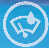
DÉTECTEUR DE PLUIE