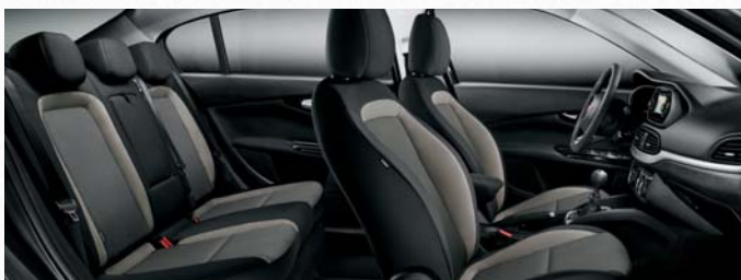
POP - INTÉRIEUR EN TISSU TAUPE ET NOIR.