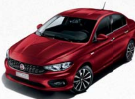
716 ROUGE AMORE MÉTALLISÉ