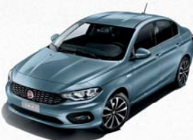
448 BLEU CANALGRANDE MÉTALLISÉ