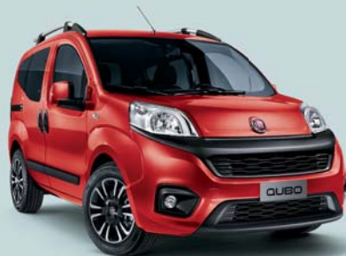
168 ROSSO PASSIONE