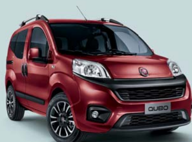
293 ROSSO AMORE