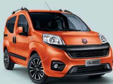
551 ARANCIO SICILIA