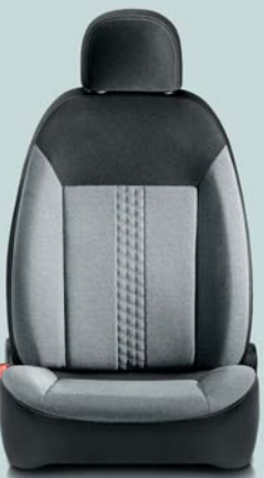
163 Melange Grigio