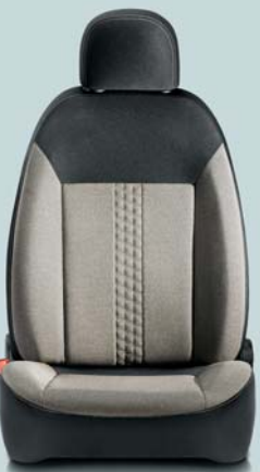
162 Melange Beige