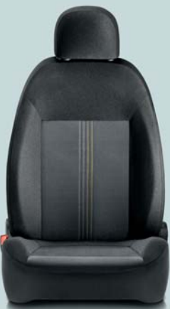
094 Jeans Nero