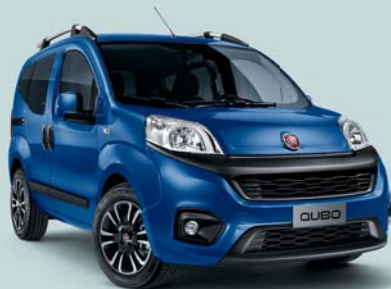
479 BLU RIVIERA