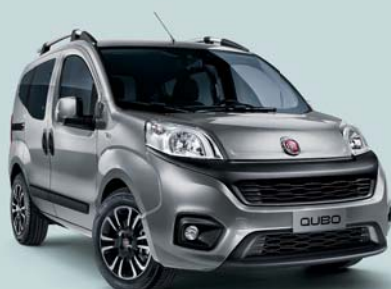
612 GRIGIO MAESTRO