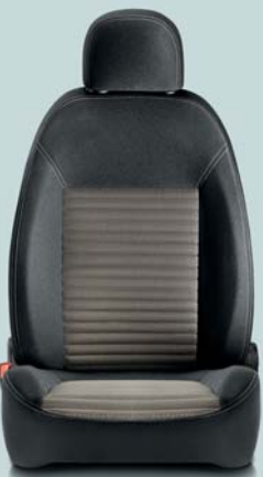
213 Sail Grigio/Nero