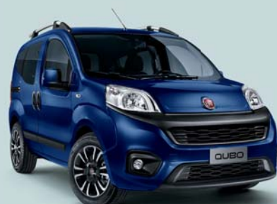
487 BLU MEDITERRANEO