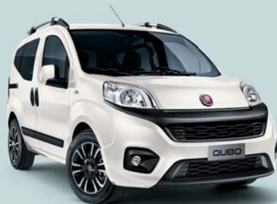
249 BIANCO GELATO