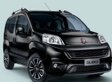
632 NERO TENORE