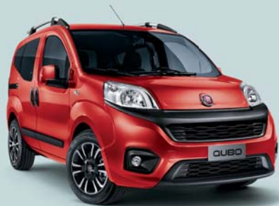
168 ROJO PASSIONE