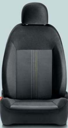
094 Negro Jeans