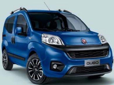
479 AZUL RIVIERA