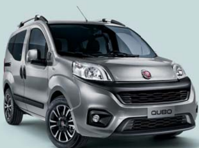
612 GRIS MAESTRO