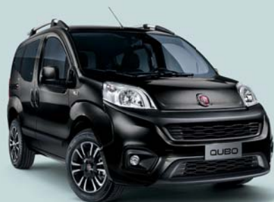
632 NEGRO TENORE