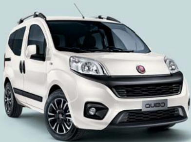
249 BLANCO GELATO