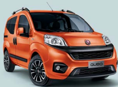
551 NARANJA SICILIA