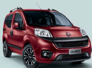
293 ROJO AMORE