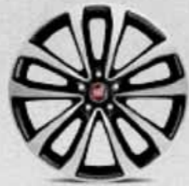
LOUNGE 17" Elmas Kesim Alaşimli Jant