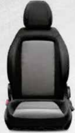
EASY/COMFORT Siyah&Gri Örgü Kumaş