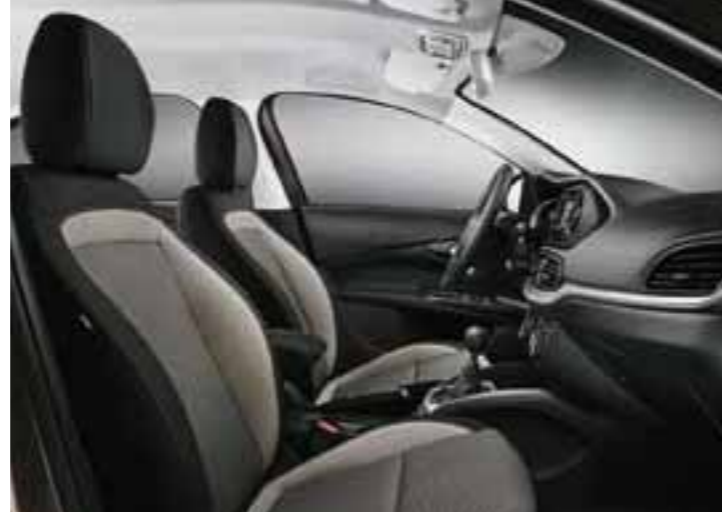
URBAN - SİYAH&BEJ - SPOR DİKİŞLİ ÖRGÜ KUMAŞ