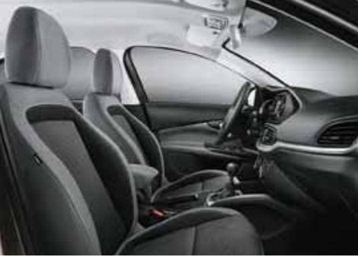
URBAN - GRİ&SİYAH - SPOR DİKİŞLİ ÖRGÜ KUMAŞ