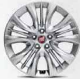
URBAN 16" Alaşimli Jant