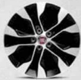
LOUNGE 16" Elmas Kesim Alaşimli Jant