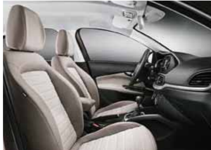
LOUNGE - BEJ - FREKANS BASKILI MELANJ KUMAŞ VE SENTETİK DERİ