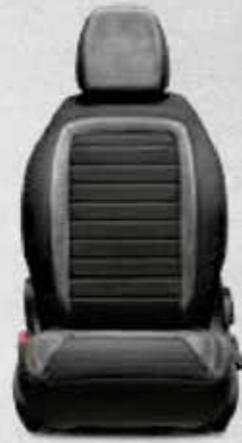
LOUNGE Gri Frekans Baskılı Melanj Kumaş ve Sentetik Deri