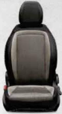
URBAN Siyah&Bej Spor Dikişli Örgü Kumaş