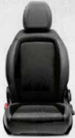
URBAN Gri&Siyah Spor Dikişli Örgü Kumaş