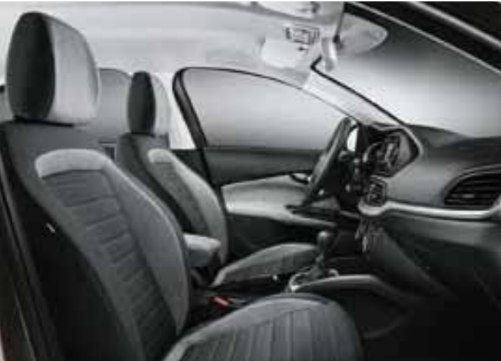
LOUNGE - GRİ - FREKANS BASKILI MELANJ KUMAŞ VE SENTETİK DERİ