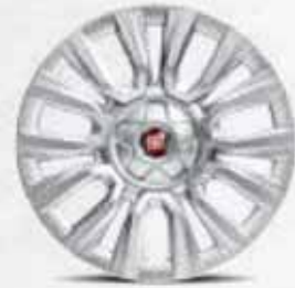
EASY/COMFORT 16" Kapaklı Jant