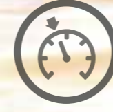
HIZ SABİTLEME SİSTEMİ