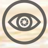
GERİ GÖRÜŞ KAMERASI