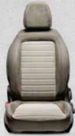
LOUNGE Bej Frekans Baskılı Melanj Kumaş ve Sentetik Deri