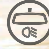
OTOMATİK KARARAN DİKİZ AYNASI