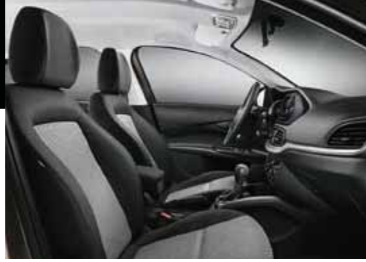
EASY - SİYAH&GRİ - ÖRGÜ KUMAŞ

YENİ FIAT EGEA, SUNDUĞU 3 FARKLI İÇ MEKAN SEÇENEĞİYLE KULLANICISININ STİLİNİ TAMAMLAYAN BİR SEDAN.