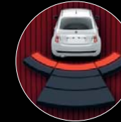
RADAR DE REcul

TECNOLOGIES INNOVANTES PAR MAGNETI MARELLI