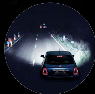
PHARES AU XENON

Il existe un secret pour faire de chaque journée un moment de bonne humeur et d'audace. Avec Fiat 500 vous le découvrez :