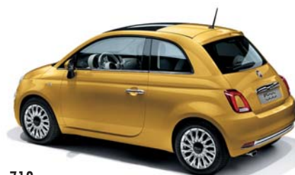
712 COUNTRYPOLITAN YELLOW