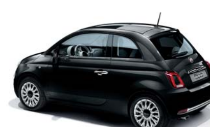
876 CROSSOVER BLACK