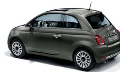
372 GROOVE METAL GREY