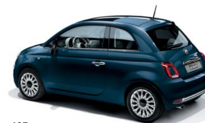
687 EPIC BLUE