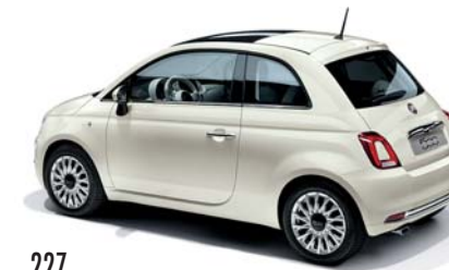
227 ICE WHITE