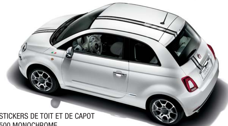
STICKERS DE TOIT ET DE CAPOT 500 MONOCHROME