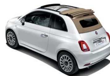
CAPOTE BEIGE LUNAIRE

500S Cabriolet seulement disponible avec capote noire