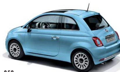
952 SOUL BLUE