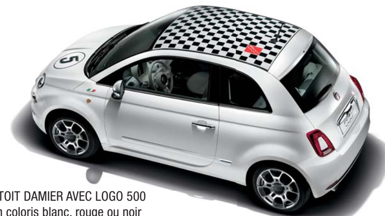
STICKER DE TOIT DAMIER AVEC LOGO 500 Disponible en coloris blanc, rouge ou noir

Stickers, coques de clés, badges latéraux, jantes alliage et même pochettes maquillage : toute une gamme d'accessoires à votre disposition pour renforcer le look de votre Fiat 500 et la rendre véritablement unique.