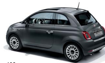
695 ELECTROCLASH GREY