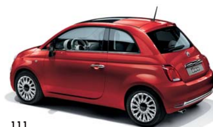
111 PASODOBLE RED