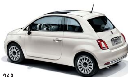
268 BOSSANOVA WHITE