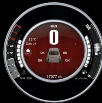
INDICATEURS DE PRESSION DES PNEUMATIQUES