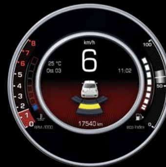
RADAR DE REcul

Pour cette raison, elle a choisi d'embarquer un écran numérique TFT de 7" . Il sert à contrôler toutes les informations qui peuvent être utiles pendant la conduite ; comme par exemple, les données du tachymètre, du compte-tours, de la température ou de l'indicateur de boîte de vitesses et de l'ordinateur de bord. De plus, le tout permet de consulter, sur le même écran, le lecteur multimédia, le téléphone et le navigateur.