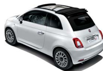
CAPOTE NOIR ÉCLIPSE