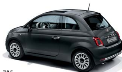
735 TECH-HOUSE GREY