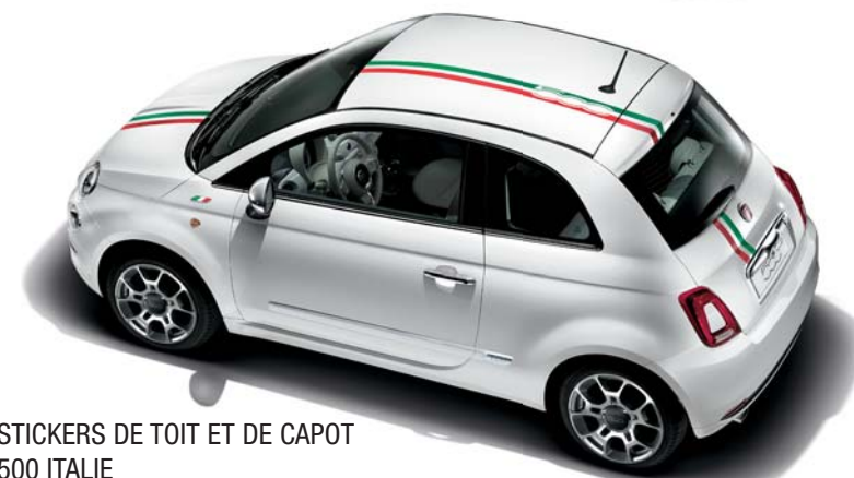
STICKERS DE TOIT ET DE CAPOT 500 ITALIE