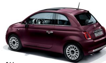
866 OPERA BORDEAUX