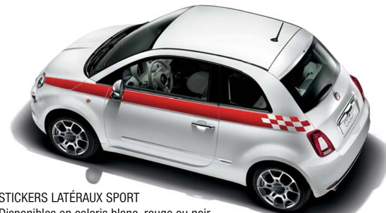
STICKERS LATÉRAUX SPORT Disponibles en coloris blanc, rouge ou noir