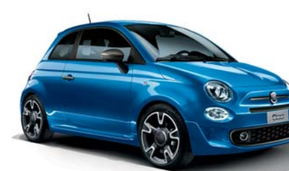
425 - EXCLUSIVE VERSION S ITALIA BLUE