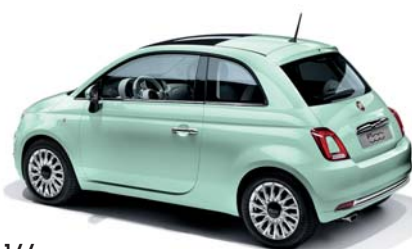
166 MINT GREEN