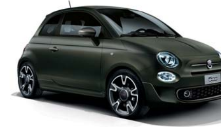
149 - EXCLUSIVE VERSION S ALPI GREEN