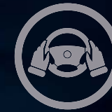
MANDOS EN EL VOLANTE