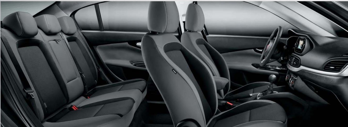
EASY - INTERIORES DE TEJIDO STRUCTURED BICOLOR GRIS OSCURO.