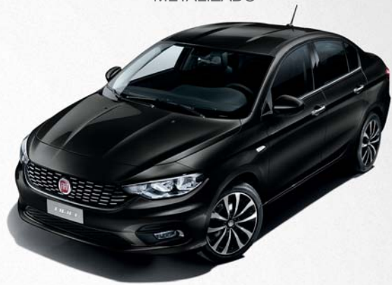
718 NEGRO CINEMA METALIZADO