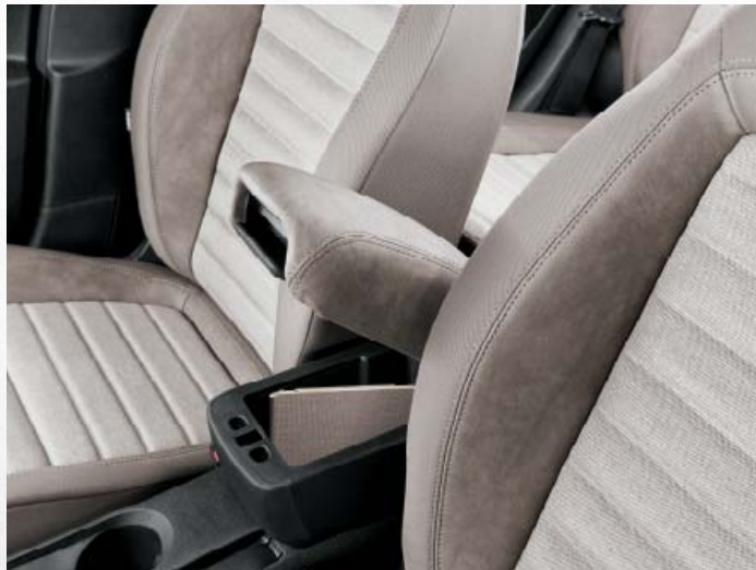
Reposabrazos delantero con compartimento portaobjetos.

Todo el confort que necesitas en 4,54 m de longitud. El Nuevo Tipo te ofrece la mejor habitabilidad de su clase, con cinco plazas cómodas y envolventes, cuatro tapicerías a elegir y un gran número de huecos portaobjetos ideales para guardar todo lo que necesitas cuando viajas. Por