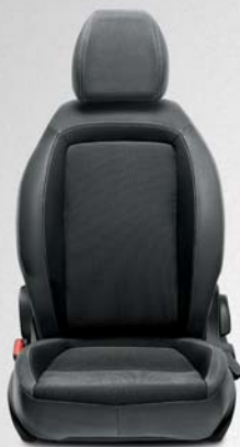
EASY GRIS OSCURO Tejido structured bicolor gris oscuro