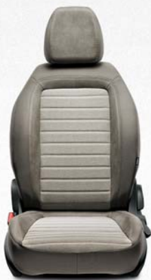
LOUNGE BEIGE Tejido electrowelded beige melange