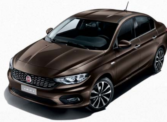
444 BRONCE MAGNÉTICO METALIZADO