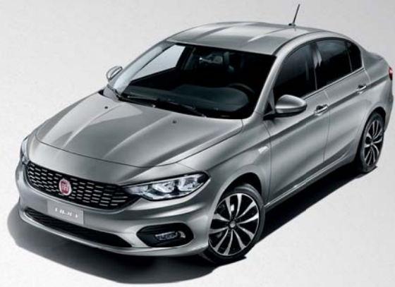
612 GRIS MAESTRO METALIZADO