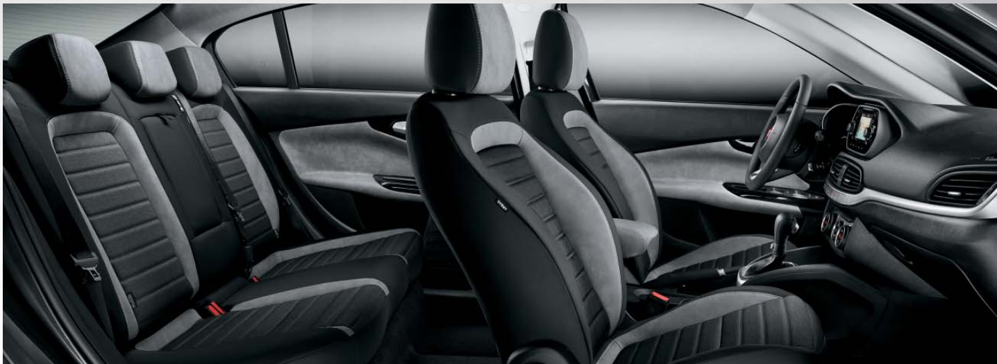
LOUNGE - INTERIORES DE TEJIDO ELECTROWELDED GRIS MELANGE.

Todo el confort que necesitas en 4,54 m de longitud. El Nuevo Tipo te ofrece la mejor habitabilidad de su clase, con cinco plazas cómodas y envolventes, cuatro tapicerías a elegir y un gran número de huecos portaobjetos ideales para guardar todo lo que necesitas cuando viajas. Por