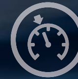
CONTROL DE VELOCIDAD