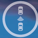
SENSORES DE APARCAMIENTO