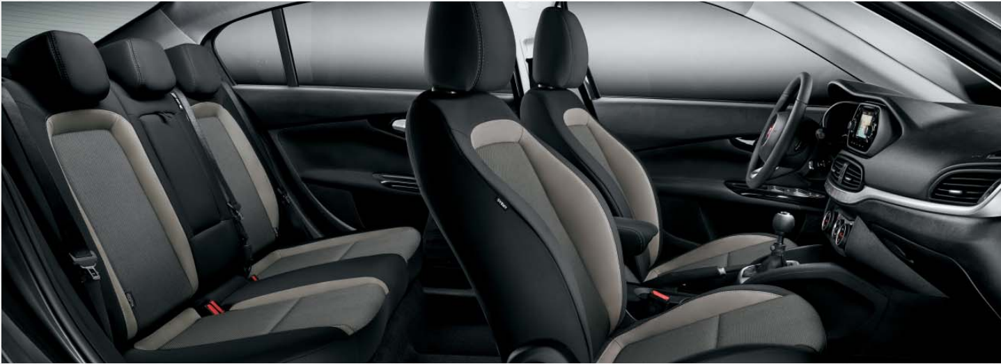
EASY - INTERIORES DE TEJIDO STRUCTURED GRIS MELANGE.