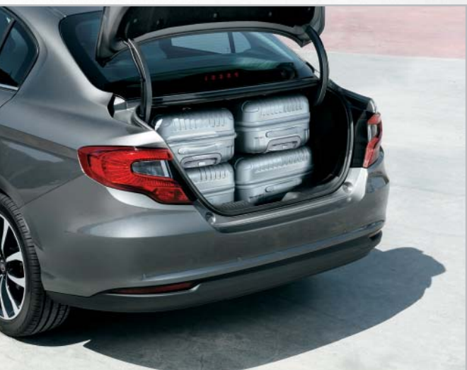
Apertura del maletero amplia y accesible para facilitar su carga y descarga.