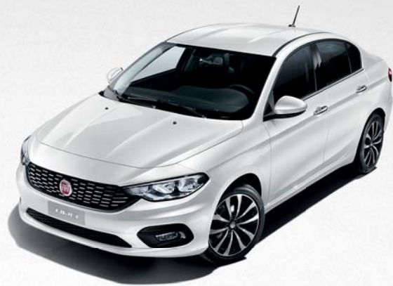
249 BLANCO GELATO SÓLIDO