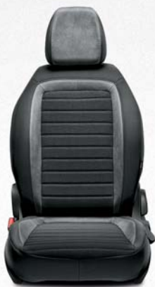
LOUNGE GRIS Tejido electrowelded gris melange