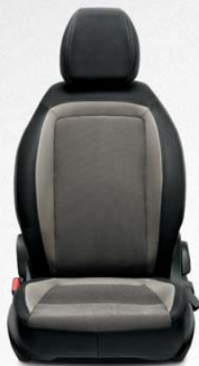
EASY GRIS Tejido structured bicolor gris melange