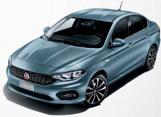
448 AZUL CANALGRANDE METALIZADO