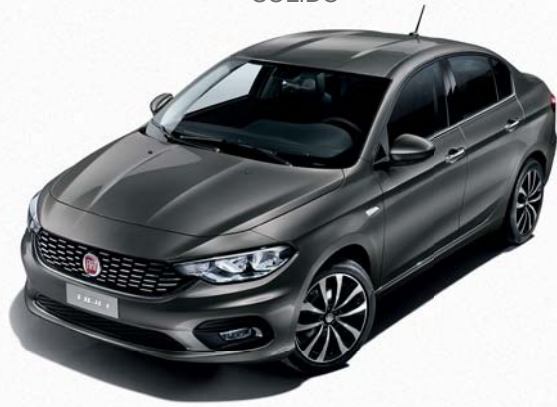
695 GRIS COLOSSEO METALIZADO