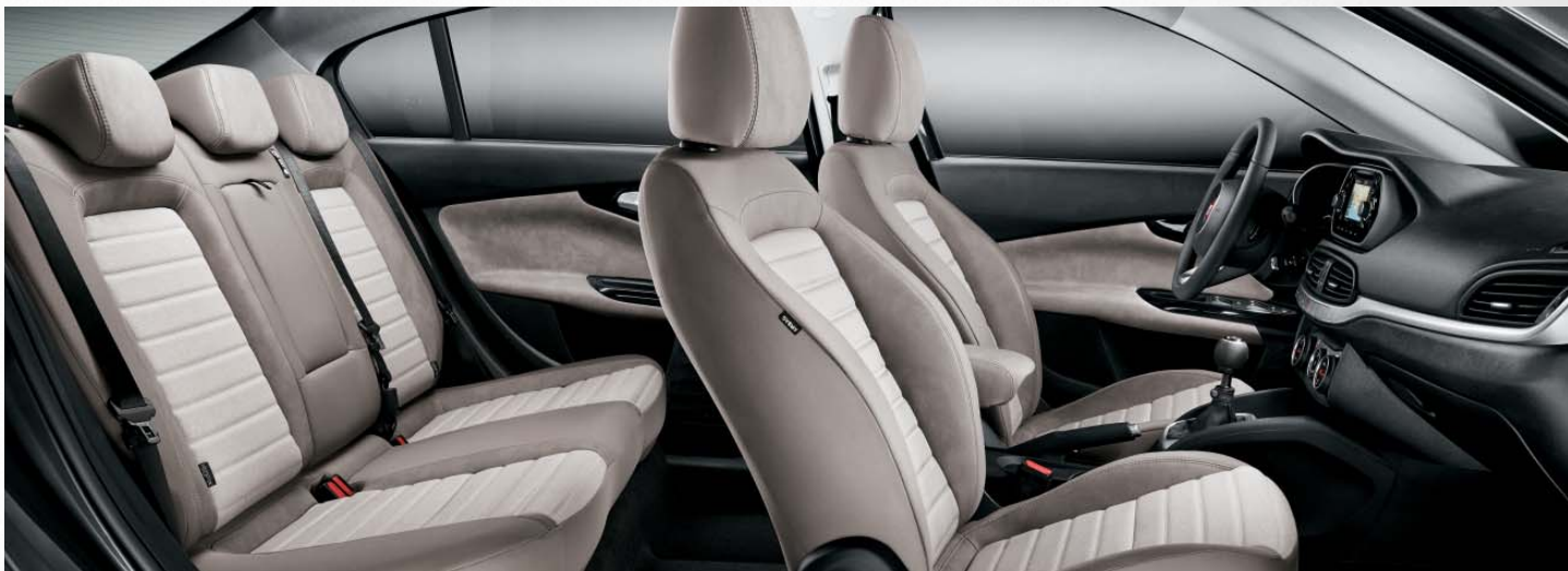
LOUNGE - INTERIORES DE TEJIDO ELECTROWELDED BEIGE MELANGE.