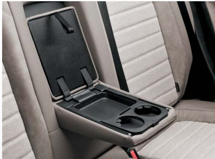
Reposabrazos trasero central con compartimento portaobjetos y portabebidas

supuesto, también su ergonomía es excelente: todos los mandos están situados en la posición justa.