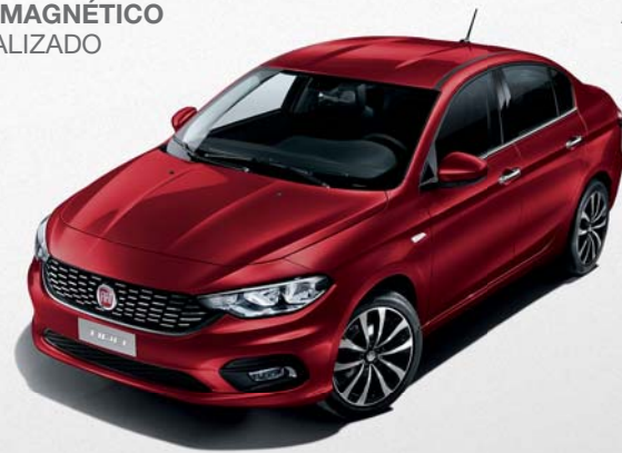
716 ROJO PASSIONE METALIZADO