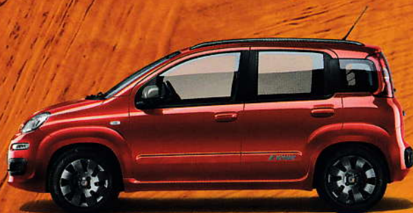
289 Rot Cupido – Pastell