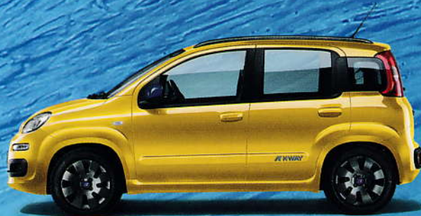
509 Gelb Sole – Pastell