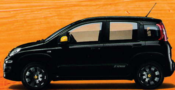
601 Schwarz Seducente – Pastell