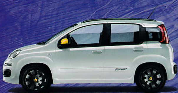
296 Weiß Gelato – Pastell