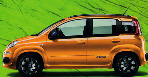
516 Orange Solare – Pastell