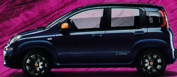
567 Blau Dipintodiblu – Metallic