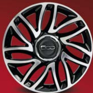
ZUBEHÖRFELGE 50926885 17"-LEICHTMETALLFELGEN IN DIAMANTSCHWARZ