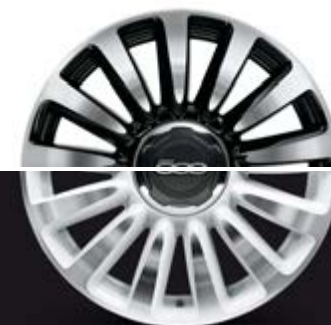
4WQ 16"-LEICHTMETALLFELGEN IN DIAMANTWEISS