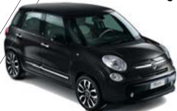
601 Cinema Schwarz weißes Dach 500L / 500L Living / 500L Trekking