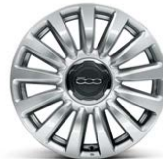
433 16"-LEICHTMETALLFELGEN IN GLOSSY SILVER