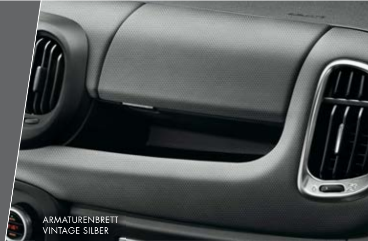
ARMATURENBRETT VINTAGE SILBER