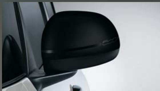
SCHWARZ MIT KERAMIK-EFFEKT