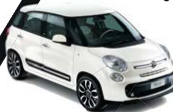
268 Gelato Weiß schwarzes Dach 500L / 500L Living / 500L Trekking