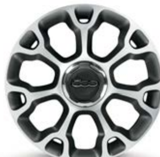
5EQ 17"-LEICHTMETALLFELGEN IN DIAMANTSCHWARZ (nur für 500L Trekking)