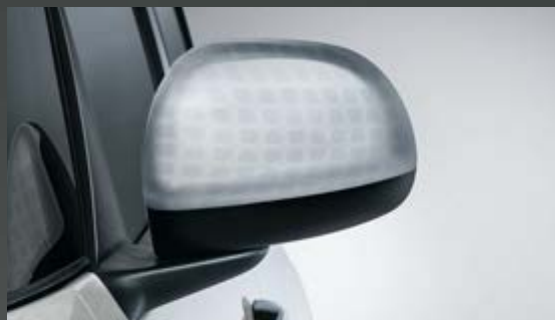
ALUMINIUM MIT TECHNIK-EFFEKT SILBER