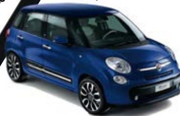
530 Venezia Blau metallic weißes Dach/schwarzes Dach 500L / 500L Trekking