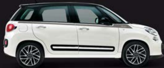
■ „STRIPE 500“, GRAU/SILBER