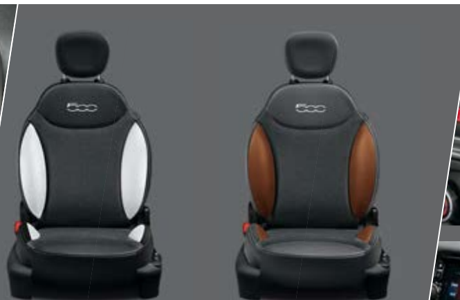
STOFF TECNOSILK SCHWARZ/WEISS