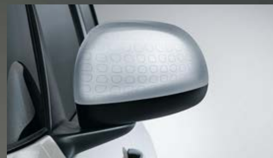
ALUMINIUM MIT TECHNIK-EFFEKT OUTLINE