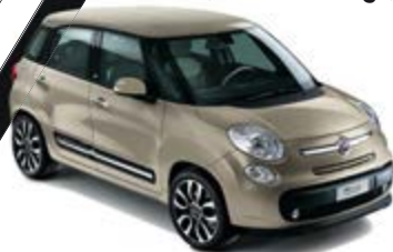
231 Cappuccino Beige weißes Dach/schwarzes Dach 500L / 500L Living / 500L Trekking