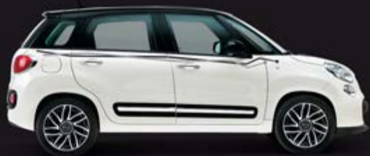
■ „FLASH“, ANTHRAZIT/SILBER

Individualisieren Sie Ihren 500L mit den einzigartigen Aufklebern in zahlreichen Farbvarianten und mit vielen graphischen Motiven.