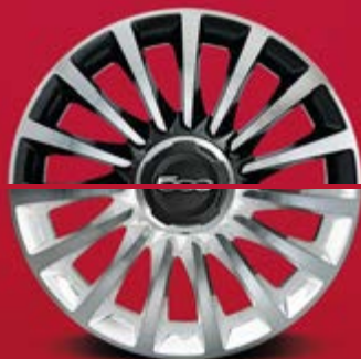
6Y8 ZUBEHÖRFELGE 50927079 17"-LEICHTMETALLFELGEN IN DIAMANTWEISS