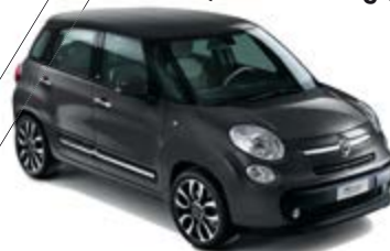
609 Moda Grau metallic weißes Dach 500L / 500L Living / 500L Trekking