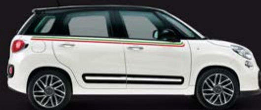
■ „ITALIENISCHE FLAGGE“