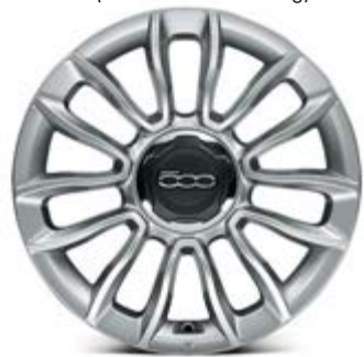
439 16"-LEICHTMETALLFELGEN IN GLOSSY SILVER