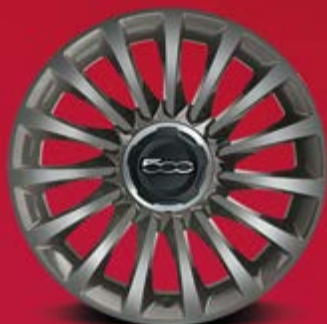
6U4 ZUBEHÖRFELGE 50926886 17"-LEICHTMETALLFELGEN IN GRAU