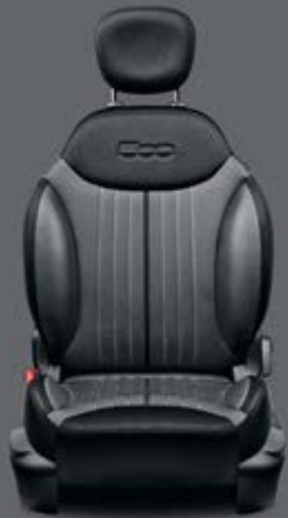
STOFF NATTÉ SCHWARZ/GRAU

2 verschiedene Farben für das Armaturenbrett, mit 3 Innenausstattungen, 10 Karosseriefarben und 15 Bicolore-Kombinationen.