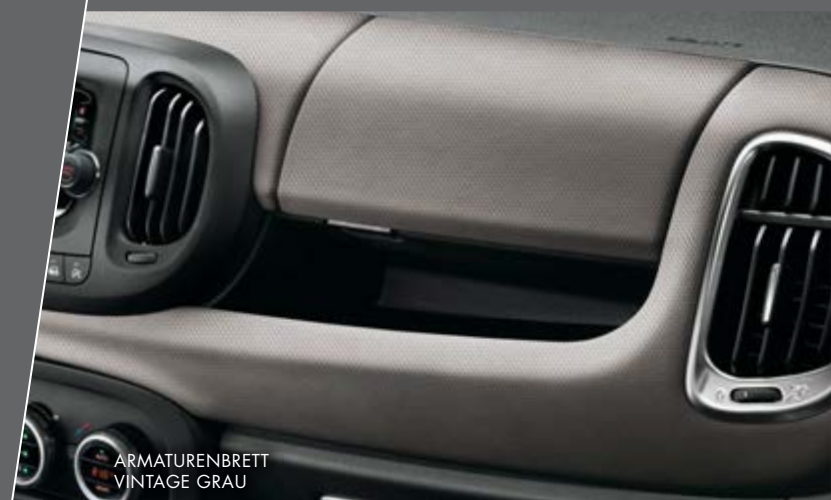
ARMATURENBRETT VINTAGE GRAU