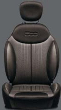
STOFF NATTÉ BRAUN/GRAU