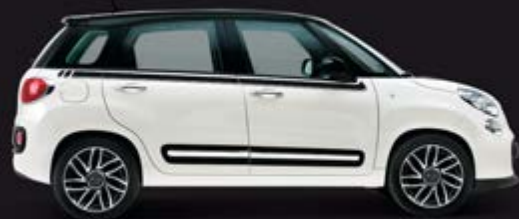
■ „STRIPE“, SCHWARZ