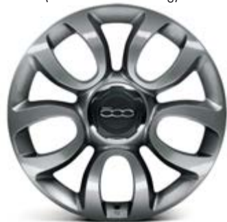
435 17"-LEICHTMETALLFELGEN IN GRAU