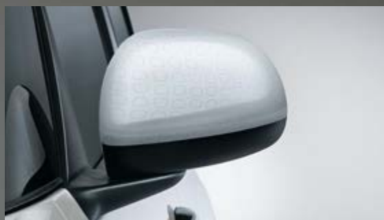
WEISS MIT TECHNIK-EFFEKT OUTLINE