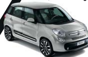
612 Maestro Grau metallic schwarzes Dach 500L / 500L Living