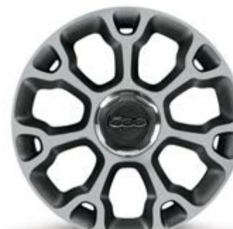
68Q 17"-LEICHTMETALLFELGEN IN DIAMANTSCHWARZ MATT (nur für 500L Trekking)