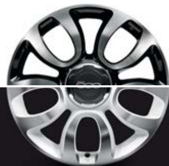
5FB 17"-LEICHTMETALLFELGEN IN DIAMANTWEISS