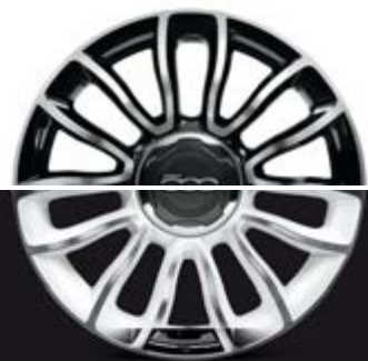
55E 16"-LEICHTMETALLFELGEN IN WEISS GLÄNZEND