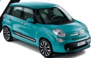
440 Pantelleria Türkis weißes Dach/schwarzes Dach 500L / 500L Trekking