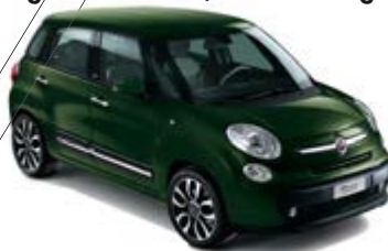
390 Toscana Grün metallic weißes Dach 500L / 500L Living / 500L Trekking