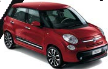
108 Amore Rot metallic weißes Dach/schwarzes Dach 500L / 500L Living / 500L Trekking