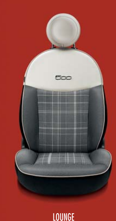
LOUNGE 374 Stoff „Prince of Wales“ Schwarz/Weiß mit Akzenten in Elfenbein