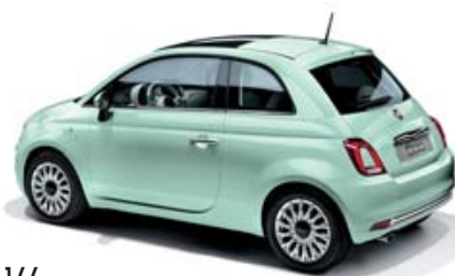
166 LATTEMENTA GRÜN