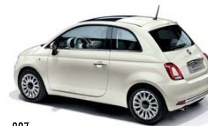
227 GHIACCIO WEISS