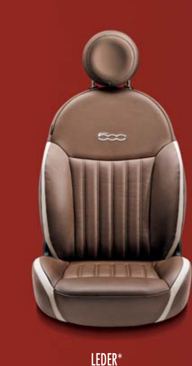
LEDER* 461 Leder Poltrona FRAU® Tabak/Elfenbein