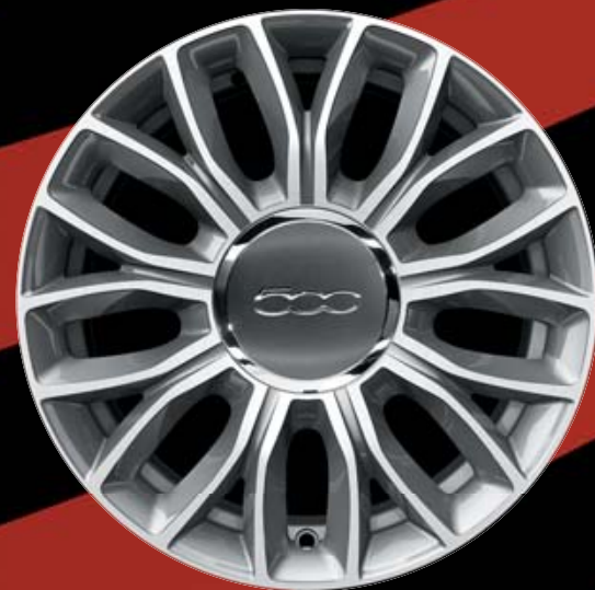
15"-LEICHTMETALLFELGEN IN DIAMANTOPTIK (9 SPEICHEN) 5YN