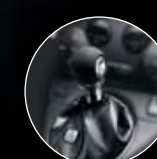
LEDERSCHALTKNAUF IN SCHWARZ (optional)