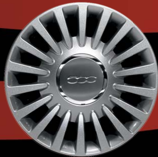
15"-LEICHTMETALLSPORTFELGEN (18 SPEICHEN) 431