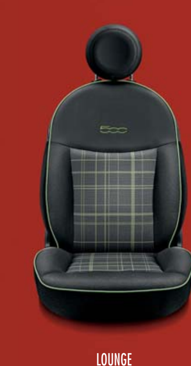
LOUNGE 302 Stoff „Prince of Wales“ Schwarz/Grau mit Akzenten in Grün