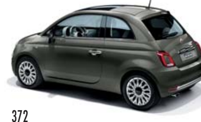
372 COLOSSEO GRAU