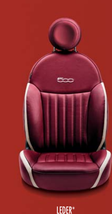
LEDER* 861 Leder Poltrona FRAU® Bordeaux/Elfenbein