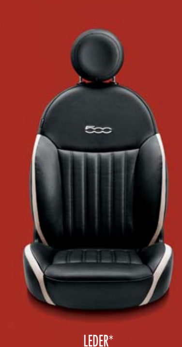
LEDER* 686/687 Leder Poltrona FRAU® Schwarz/Elfenbein