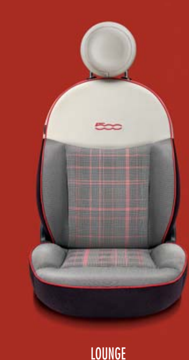
LOUNGE 605 Stoff „Prince of Wales“ Elfenbein/Braun mit Akzenten in Korall