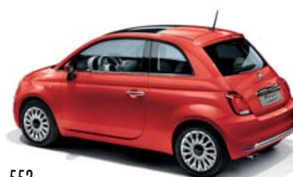
552 CORALLO ROT