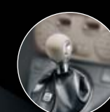
LEDERSCHALTKNAUF IN ELFENBEIN (optional)