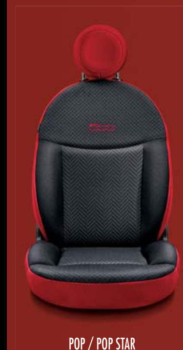
POP / POP STAR 241/273 Stoff Chevron Schwarz/Rot