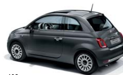
695 POMPEI GRAU