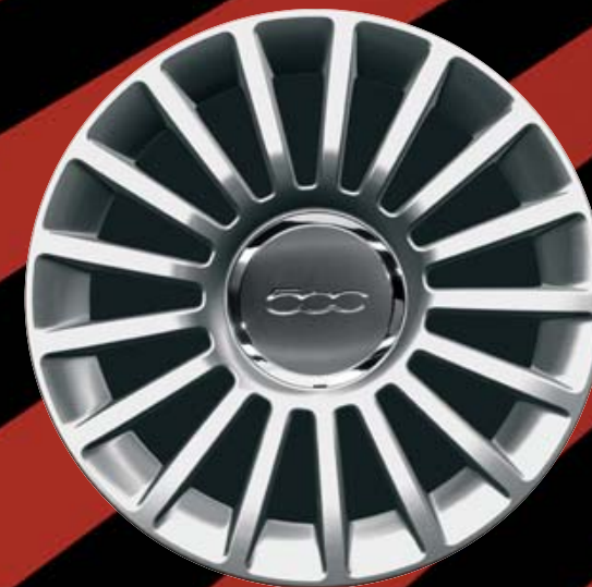
16"-LEICHTMETALLFELGEN (17 SPEICHEN) 435