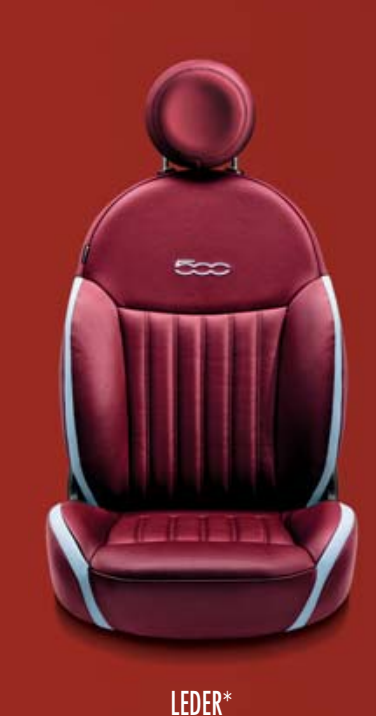
LEDER* 688 Leder Poltrona FRAU® Bordeaux/Blau