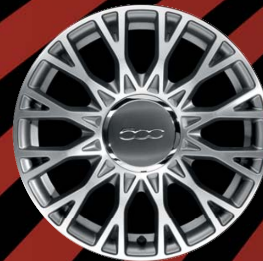
16"-LEICHTMETALLFELGEN (12 DOPPELSPEICHEN) 5EQ