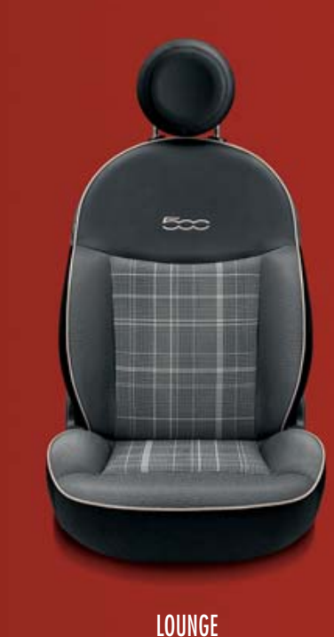
LOUNGE 301 Stoff „Prince of Wales“ Schwarz/Grau mit Akzenten in Weiß