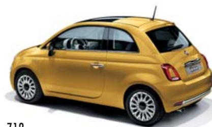
712 SOLE GELB