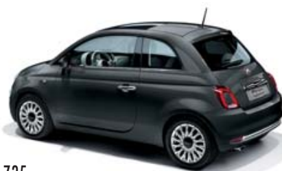
735 CARRARA GRAU