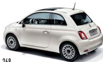
268 GELATO WEISS