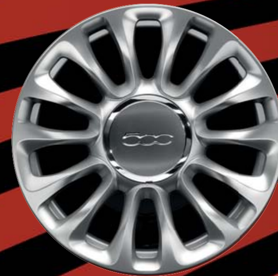
15"-LEICHTMETALLFELGEN (14 SPEICHEN) 6U4