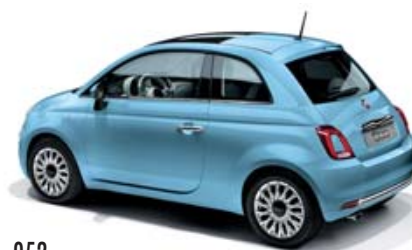
952 VOLARE BLAU