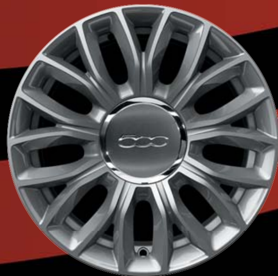
15"-LEICHTMETALLFELGEN (9 SPEICHEN) 73Z