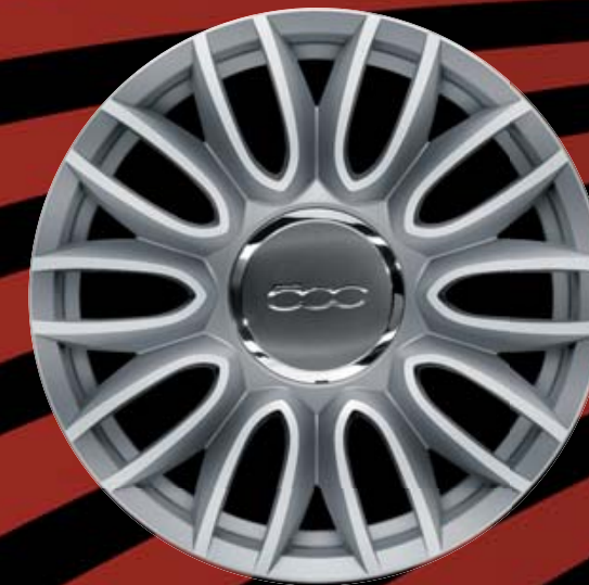
16"-LEICHTMETALLFELGEN (10 SPEICHEN) 74A