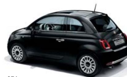
876 VESUVIO SCHWARZ