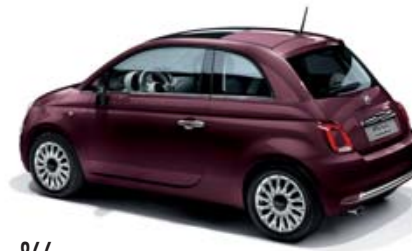
866 OPERA BORDEAUX