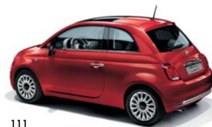
111 PASSIONE ROT