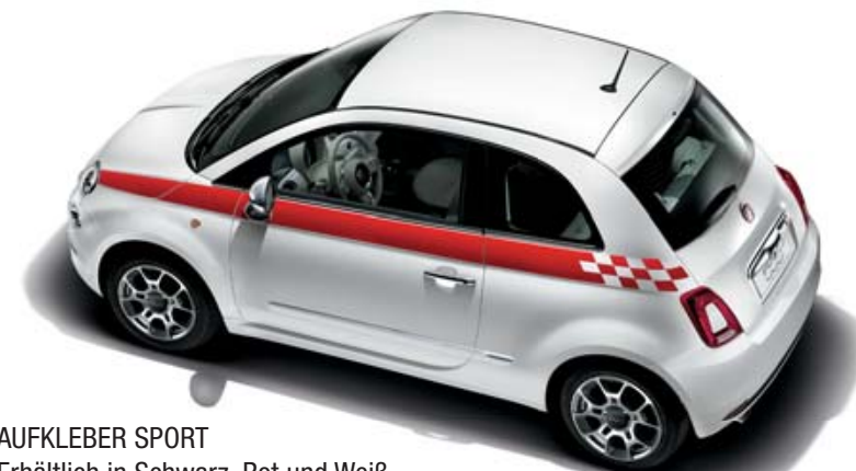
AUFKLEBER SPORT Erhältlich in Schwarz, Rot und Weiß.