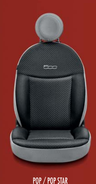
POP / POP STAR 243/359 Stoff Chevron Schwarz/Grau