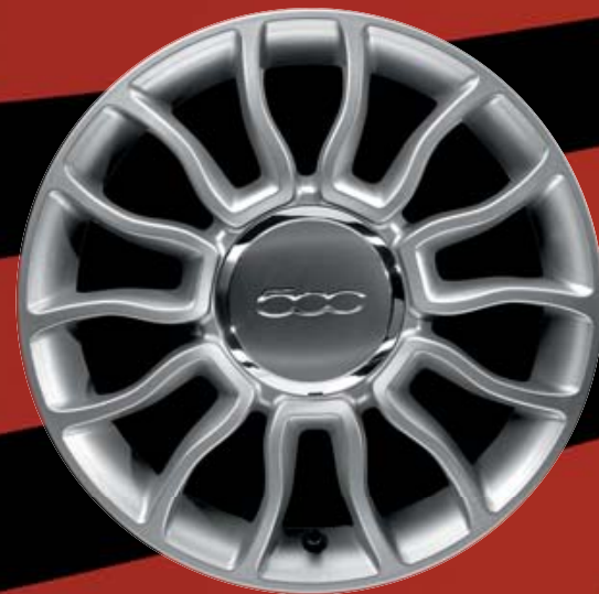
15"-LEICHTMETALLSPORTFELGEN (7 SPEICHEN) 4WQ