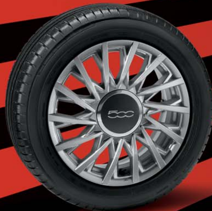
15" LEICHTMETALLFELGEN (14 DOPPELSPEICHEN) 74B