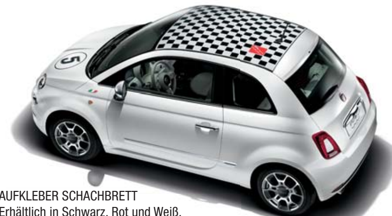
AUFKLEBER SCHACHBRETT Erhältlich in Schwarz, Rot und Weiß.

Karosserieaufkleber, Schlüsselcover, Zierplaketten für außen, Aufbewahrungslösungen, iPod-Halterung und Duftspender für den Innenraum: Wer seiner Fantasie und Kreativität freien Lauf lassen will, findet für den neuen 500 alles, um aus der Designikone ein einzigartiges Designerstück zu machen.