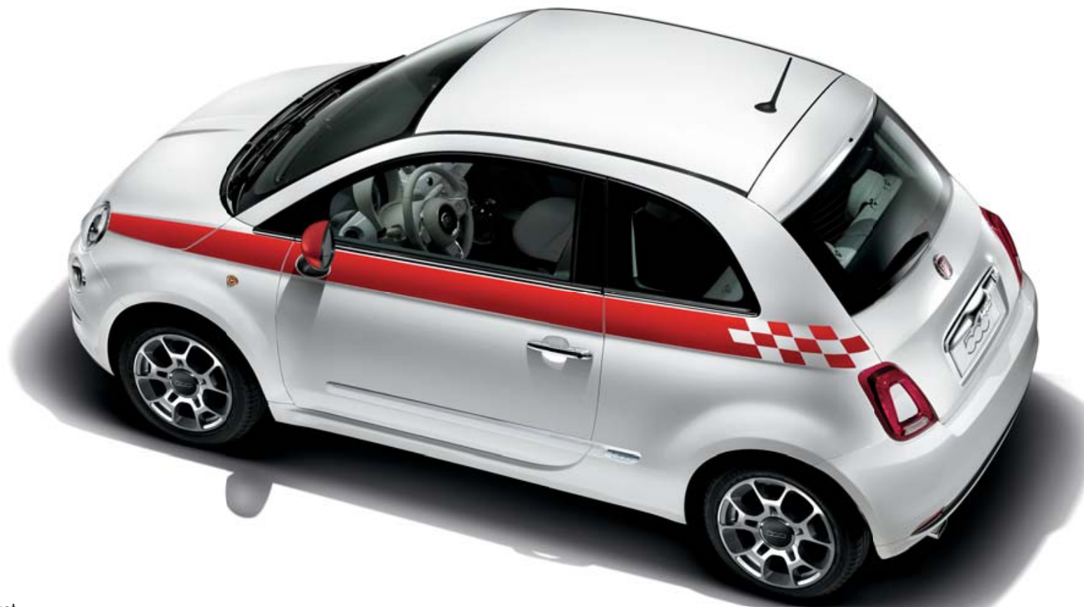
Sport-Paket Bestehend aus Außenspiegelkappen, Aufkleber-Set für die Seite und Schlüsselcover-Set. Erhältlich in Schwarz, Rot und Weiß.