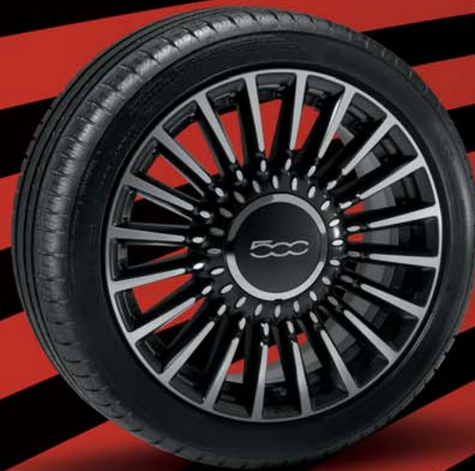
16" LEICHTMETALLFELGEN IN DIAMANTSCHWARZ (20 SPEICHEN) 5ZZ