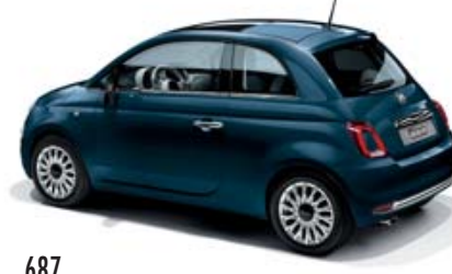
687 DIPINTO DI BLU BLAU