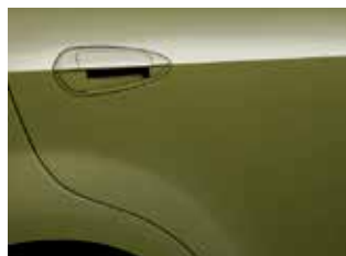
VERDE SAVAGE SÓLO ADVENTURE