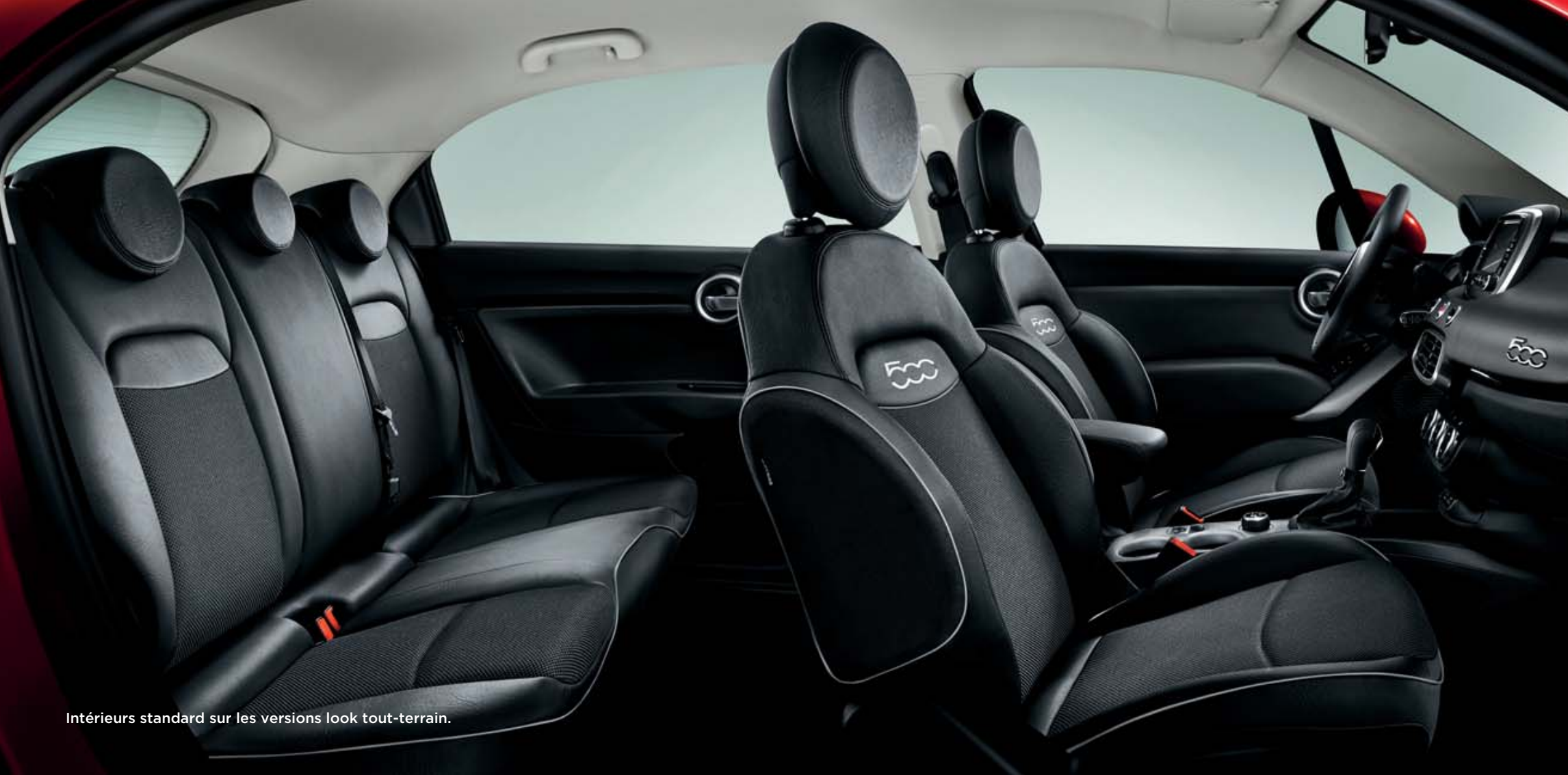
Intérieurs standard sur les versions look tout-terrain.