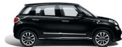
601 Nero Cinema pastello tetto bianco