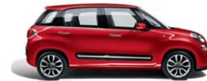
111 Rosso Passione pastello tetto bianco tetto nero