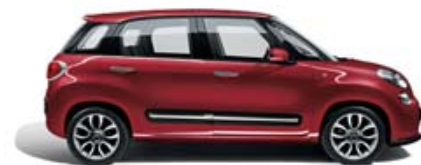
108 Rosso Amore metallizzato tetto bianco tetto nero