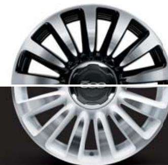
4WQ CERCHI IN LEGA 16" 205/55 R16 BIANCO DIAMANTATO