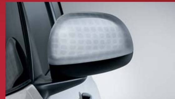
CALOTTA SPECCHIO ALLUMINIO EFFETTO TECHNICS SILVER