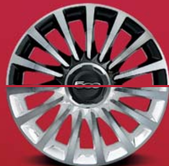
6Y8 / LINEACCESSORI 50927079 CERCHI IN LEGA 17" 225/45 R17 BIANCO DIAMANTATO