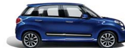
530 Blu Venezia metallizzato tetto bianco tetto nero