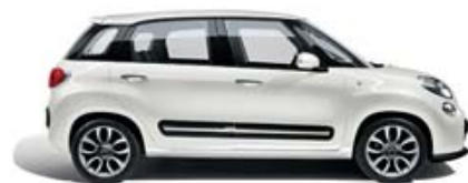
268 Bianco Gelato pastello tetto nero