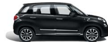
609 Grigio Moda metallizzato tetto bianco