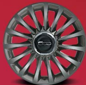
6U4 / LINEACCESSORI 50926886 CERCHI IN LEGA 17" 225/45 R17 GRIGIO ECOREFLEX