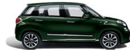
390 Verde Toscana metallizzato tetto bianco