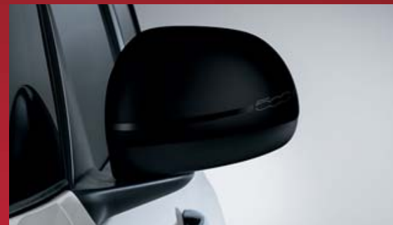
CALOTTA SPECCHIO NERA EFFETTO CERAMIC