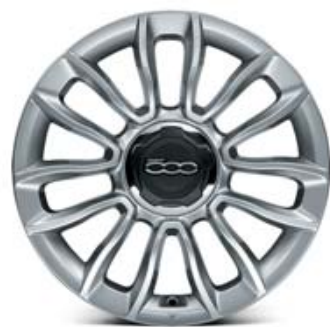
439 CERCHI IN LEGA 16" 205/55 R16 GRIGIO LUCIDO