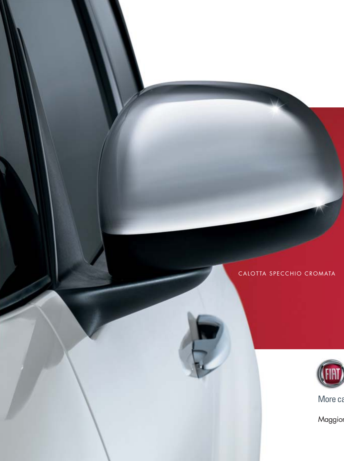
CALOTTA SPECCHIO CROMATA