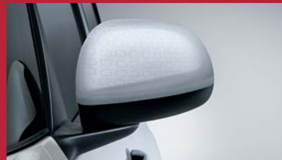
CALOTTA SPECCHIO BIANCA EFFETTO TECHNICS