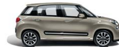
231 Beige Cappuccino pastello tetto bianco tetto nero