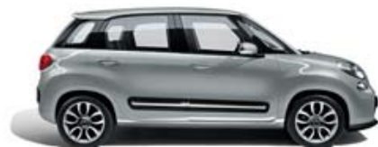
612 Grigio Maestro metallizzato tetto nero