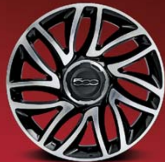
LINEACCESSORI 50926885 CERCHI IN LEGA 17" 225/45 R17 NERO DIAMANTATO