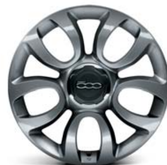
435 CERCHI IN LEGA 17" 225/45 R17 GRIGIO SCURO