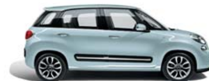
483 Azzurro Mare pastello tetto bianco tetto nero