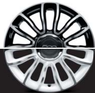
55E CERCHI IN LEGA 16" 205/55 R16 BIANCO DIAMANTATO