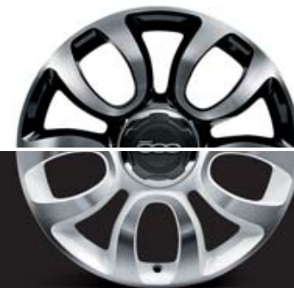
5FB CERCHI IN LEGA 17" 225/45 R17 BIANCO DIAMANTATO