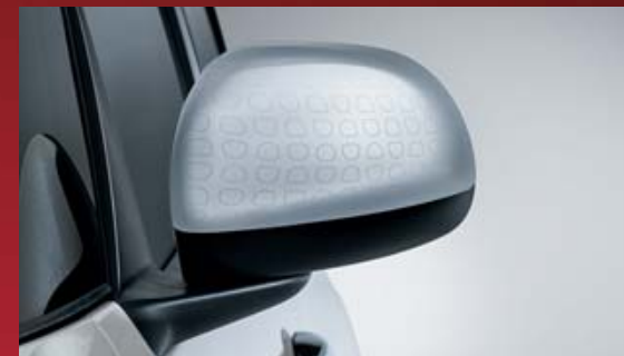
CALOTTA SPECCHIO ALLUMINIO EFFETTO TECHNICS OUTLINE