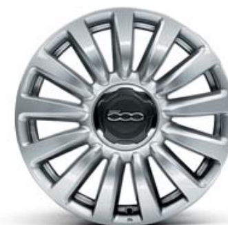
433 CERCHI IN LEGA 16" 205/55 R16 GRIGIO LUCIDO