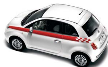
●○● Fascia laterale/Sport versione Berlina/Cabrio