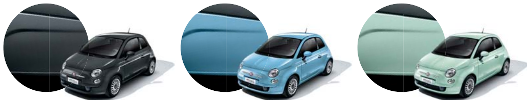
735 Grigio Carrara Pastello