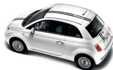
● Striscia 500 Nera