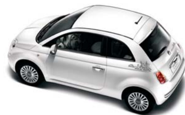
●○ New York versione Berlina/Cabrio