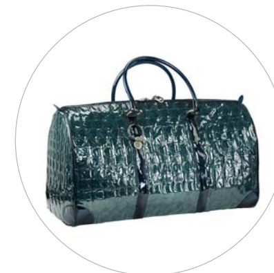
Borsoni in pluriball.