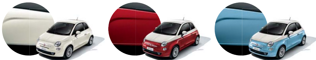
227 Bianco Ghiaccio Tristrato