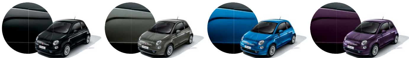
876 Nero Vesuvio Metallizzato