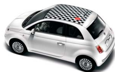
●○ Tetto a scacchi