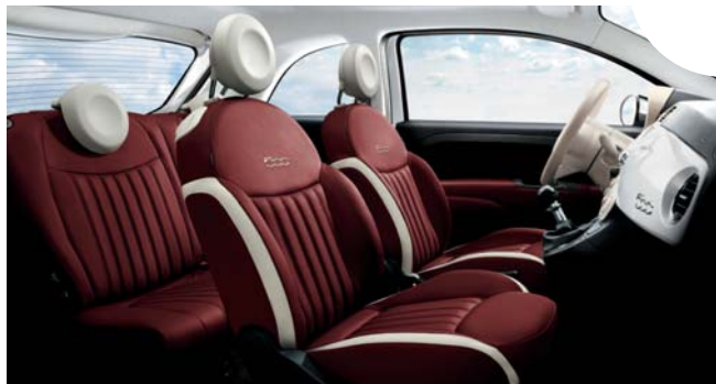
861 - 090 - 093 - 096 * (ambiente avorio) ** (ambiente nero)