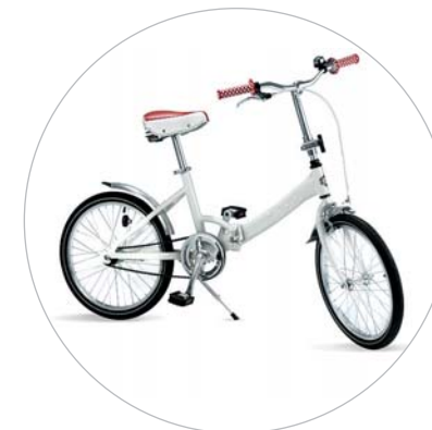
Bicicletta pieghevole con telaio in alluminio.