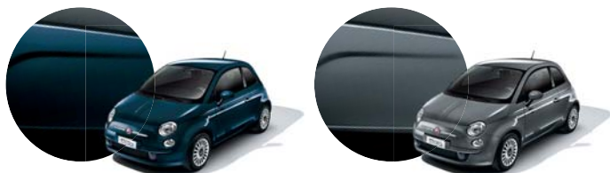
687 Blu Dipinto di blu Metallizzato