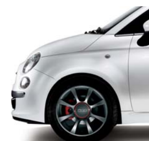
Lineaccessori 56J (16")