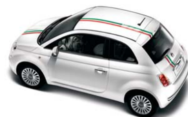
● Striscia 500 Italia