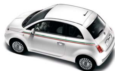
● Striscia laterale Italia versione Berlina/Cabrio