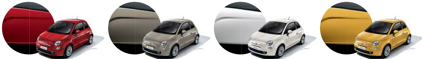
111 Rosso Passione Pastello