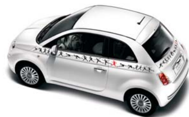
●●● Umanoide versione Berlina/Cabrio