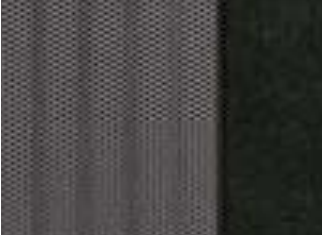
372 SAIL GRIS