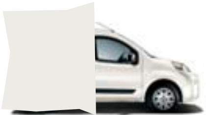
249 BLANCO GELATO