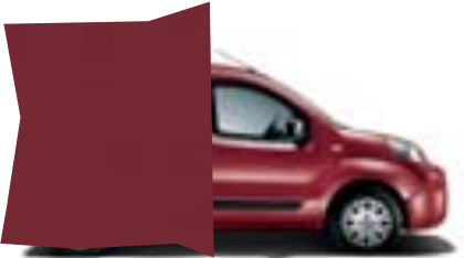
293 ROJO AMORE