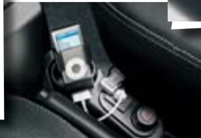
Con el soporte iPod® tu lector preferido está alojado de modo práctico y seguro.

Los riders fanáticos del snowboard no pueden perderse el Fiat Qubo con la personalización Nitro, diseñado en colaboración con la homónima empresa de tablas de snowboard. Este kit especial, disponible en todas las versiones, incluye barras transversales y cofre de techo, personalización con vinilo Nitro, snowboard y mochila Nitro.