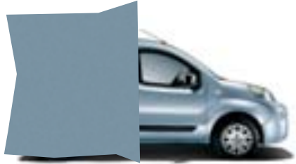
448 AZUL CANALGRANDE