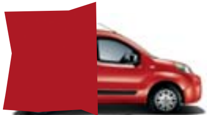
168 ROJO PASSIONE