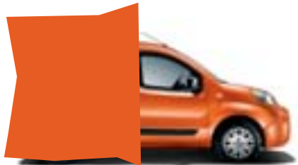
551 NARANJA SICILIA