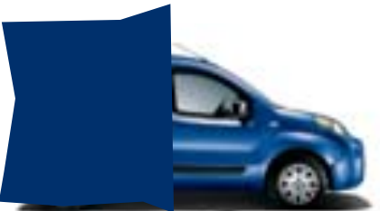
479 AZUL RIVIERA