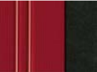
220 AXELL ROJO