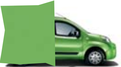
355 VERDE BELVEDERE