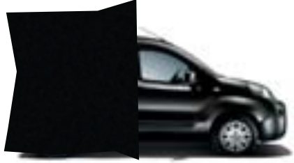
632 NEGRO TENORE