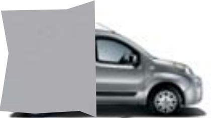
612 GRIS MAESTRO