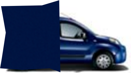
487 AZUL MEDITERRANEO