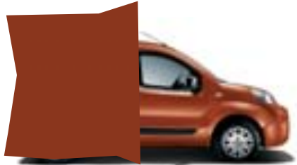
112 NARANJA CIAO