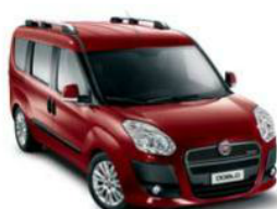
293 Rosso Amore