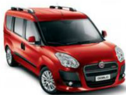
168 Rosso Passione