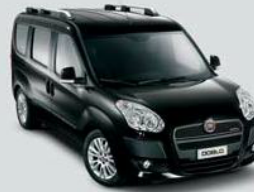
632 Nero Tenore