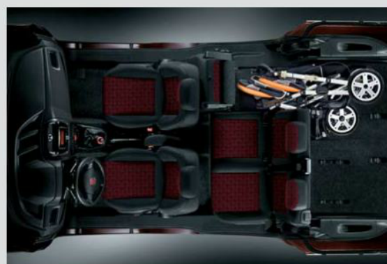
5 comodi posti e tanto spazio per i bagagli ingombranti.