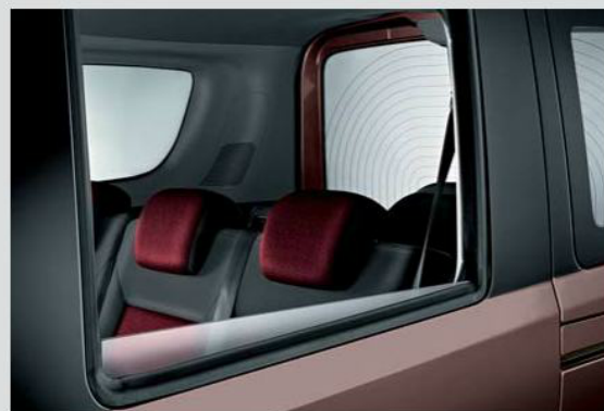
Porte posteriori scorrevoli con alzacristalli elettrici di serie.