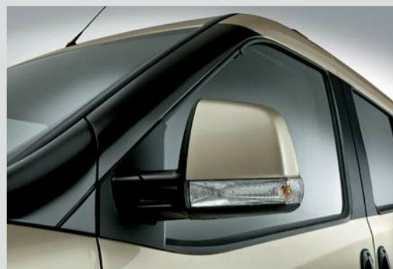
Specchi retrovisori esterni con indicatori di direzione integrati.