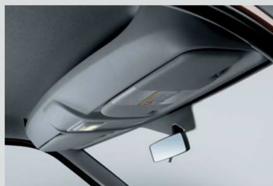
Mensola portaoggetti sopra al parabrezza.