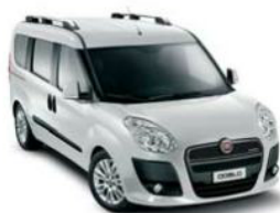
249 Bianco Gelato