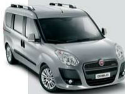
612 Grigio Maestro