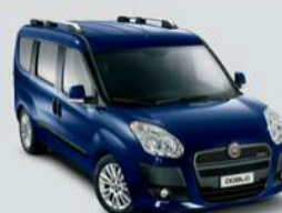
487 Blu Mediterraneo