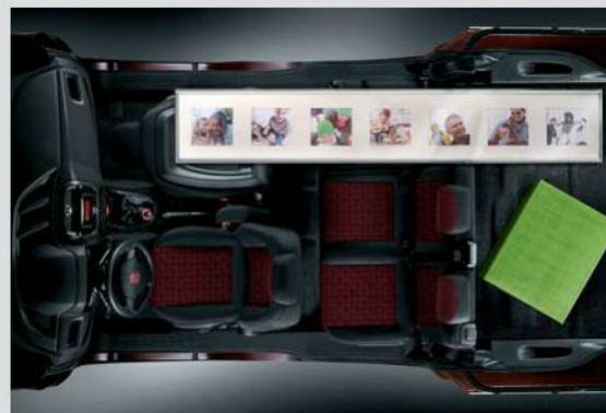
I sedili ripiegabili e abbattibili garantiscono un abitacolo estremamente versatile.