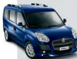
479 Blu Riviera