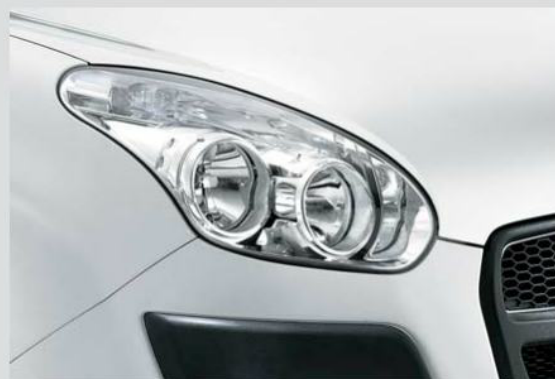
Proiettori su tre dimensioni, avvolgenti e caratteristici, con indicatori di direzione.