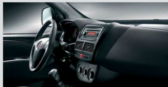
Plancia Grey Dynamic