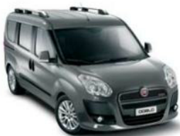
595 Grigio Pompei