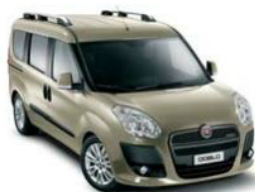
261 Bianco Spumante