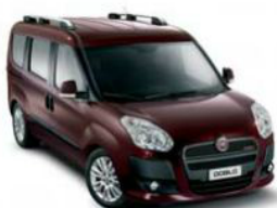
590 Bordeaux Montalcino