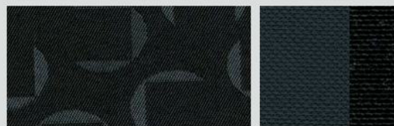
Pacman Grey 112 - 233