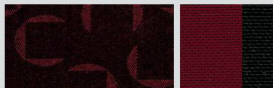
Pacman Red 184