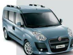
448 Azzurro Canalgrande