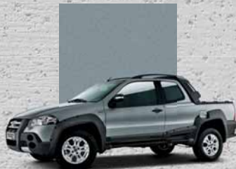
692 Grigio Scandium