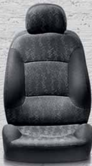
393 Tessuto Jacquard Trib