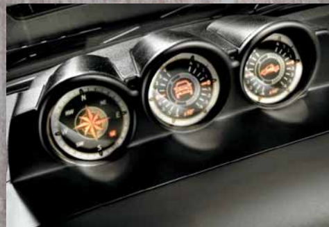
Bussola e inclinometro su Strada Adventure E-Locker.

A richiesta, su Strada Adventure, sono disponibili gli interni in pelle personalizzati.