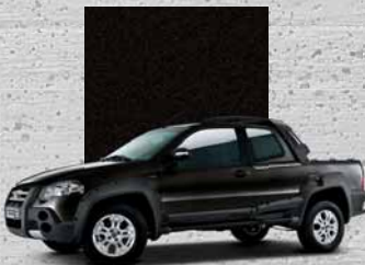
807 Nero Vesuvio