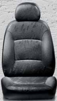
309 Tessuto Jacquard Rede