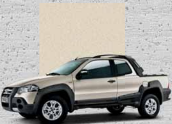
761 Beige Savannah