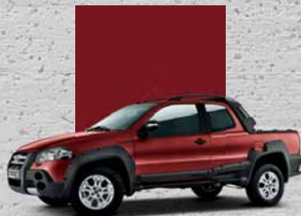
155 Rosso By Lumberjack