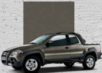
301 Grigio Terra