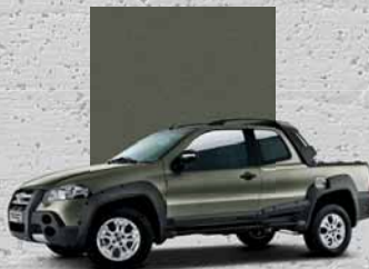
577 Verde Savage