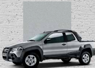
619 Argento Bari