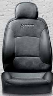
342 Tessuto Jacquard Pietra