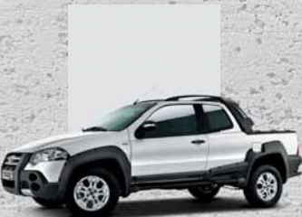
249 Bianco Banchisa