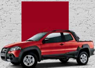
178 Rosso Alpine