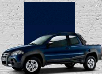
460 Blu Trinidad