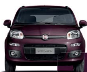
184 Berenjena Micalizado