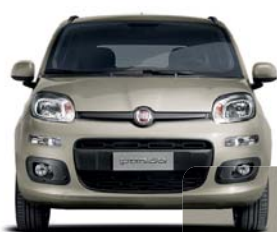
715 Caffelatte Pastel