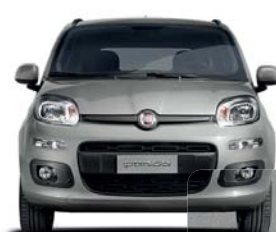
565 Gris Lluvia Metalizado