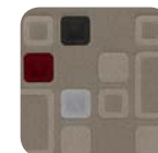
310 Tejido Rubik Gris Oscuro / Arena