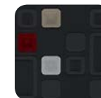
381 Tejido Rubik Rojo / Gris Oscuro