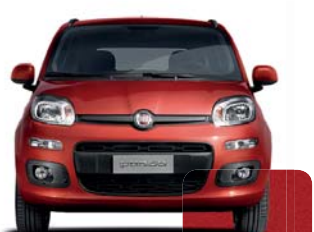
147 Rojo Geranio Metalizado