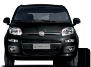
601 Negro Seducción Pastel