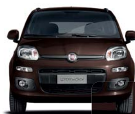
833 Marrón Chocolate Pastel