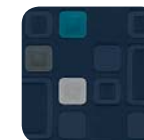
319 Tejido Rubik Gris Claro / Azul