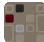
376 Tejido Rubik Gris Oscuro / Arena