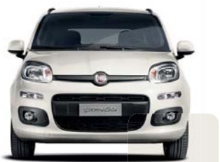
223 Blanco Nube Pastel