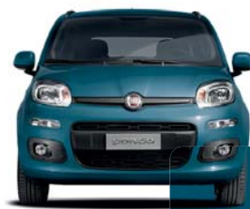
403 Turquesa Pastel