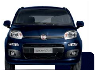
567 Azul Mediterráneo Metalizado