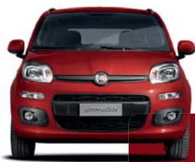
289 Rojo Amapola Pastel