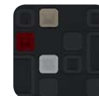
351 Tejido Rubik Rojo / Gris Oscuro