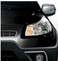
975 Hard Rock Schwarz*