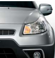
977 Techstep Grau*