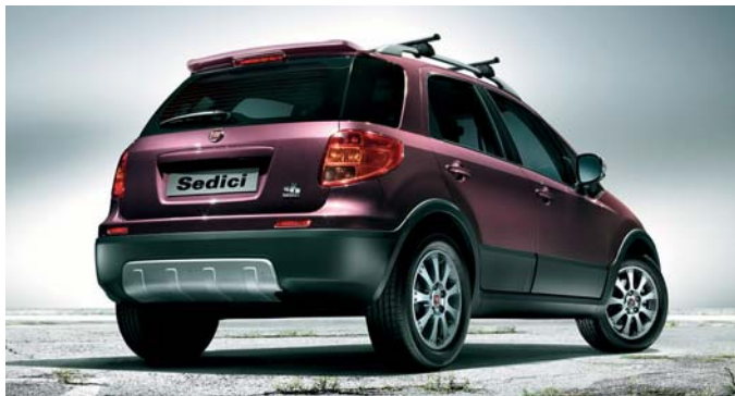
Satz Einstiegsleisten In Aluminium mit Gummibesatz.