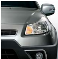
976 West Coast Grau*