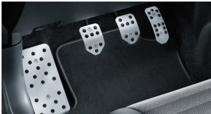
Satz Sportpedale In Aluminium mit Noppen aus Gummi.