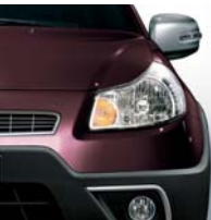
198 Purple Haze