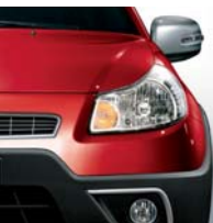
982 Space Rock Rot