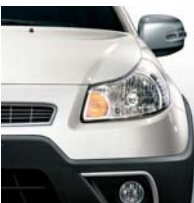
983 Castlewalk Weiß