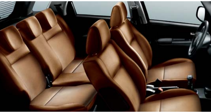
495 Leder Braun*