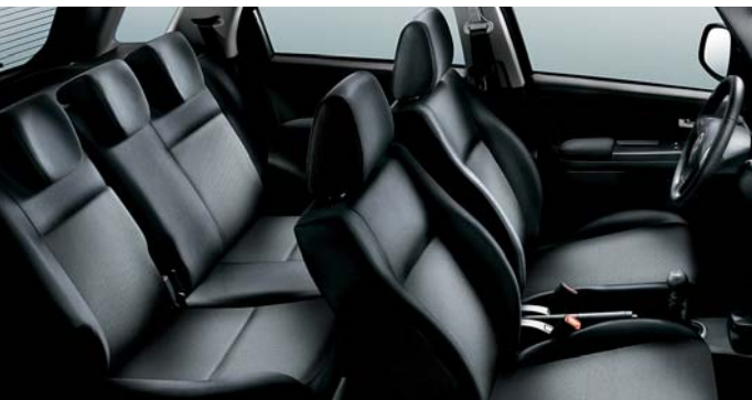
121 Stoff Grau