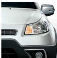
211 White Water Pearl (Eisweiß)*