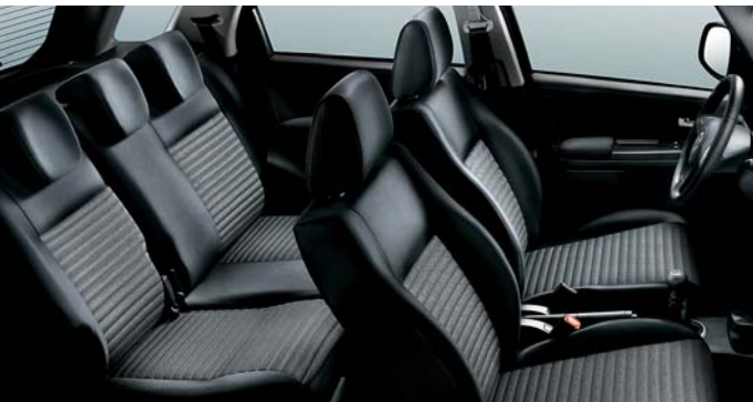
112 Stoff Grau Elegance