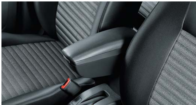
Mittelarmlehne Mit integriertem Ablagefach.