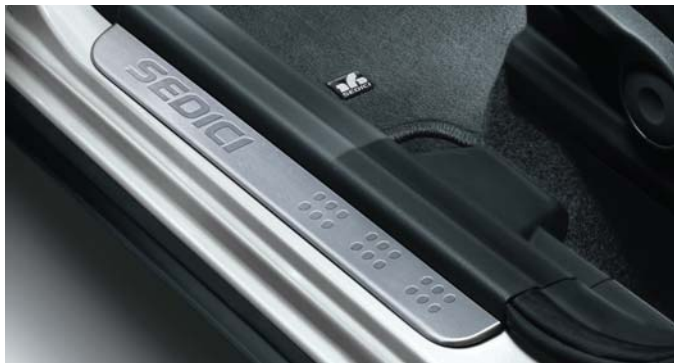
Satz sportliche Zierrahmen Rahmen in Aluminiumoptik für die Mittelarmatur, die Belüftungselemente und die Türgriffe innen.