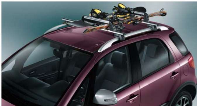
Dachreling grau lackiert mit Skiträgern (für 3 Skier oder 2 Snowboards).