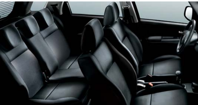
423 Leder Schwarz*