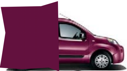
118 - FUCHSIA