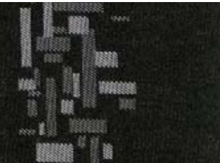
217 TISSU TANGRAM