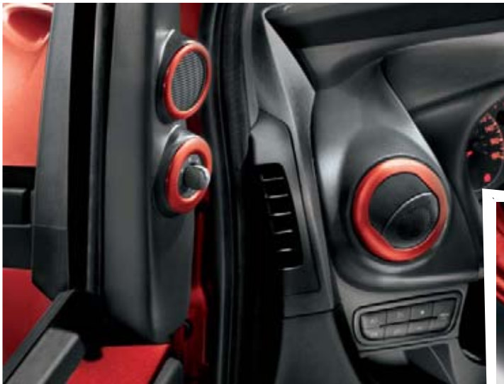
Garnitures Chrome Shadow pour un look moderne (accessoire).

Unique et inimitable, Qubo vous ressemble. Personnalisez-le grâce à une large gamme d'accessoires : tapis de sol avec logo brodé, seuils de portes, support iPod® diffuseur de parfum. Et pour vos loisirs, la gamme Lineaccessori s'étoffe : barres transversales avec porte-windsurf, porte-skis ou porte-vélos.