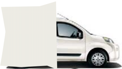
249 - BLANC