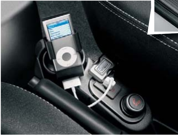
Le support iPod® vous permet de voyager au rythme de votre musique préférée (accessoire).