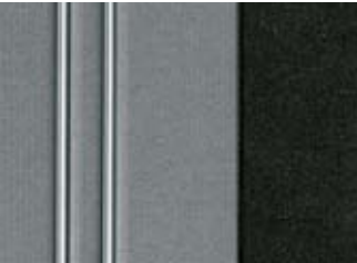
288 TISSU AXEL GRIS