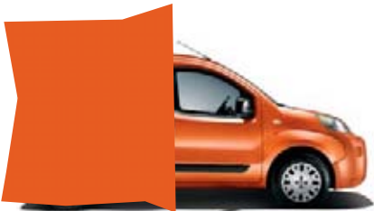
551 - FUNKY ORANGE*