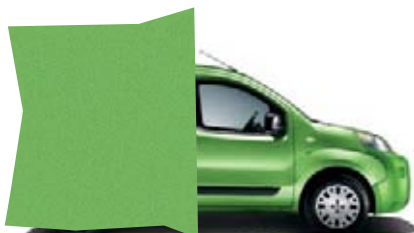
355 - VERT