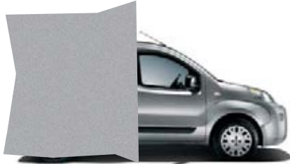
612 - GRIS MINIMAL