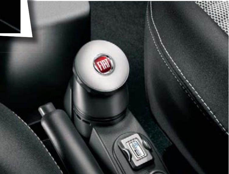
Diffuseur de parfum (accessoire).