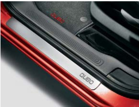
Seuil de porte tout en élégance (accessoire).