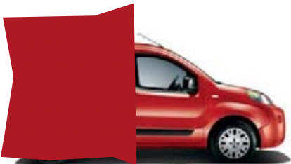
168 - ROUGE PIMPANT