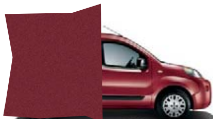
293 - ROUGE FLAMENCO