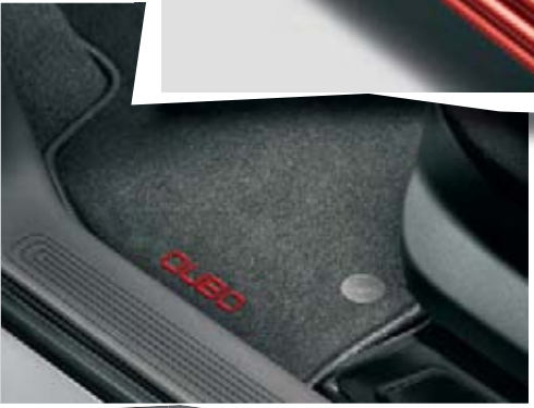
Tapis de sol en tissu avec logo brodé (accessoire).