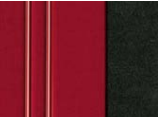
220 TISSU AXEL ROUGE