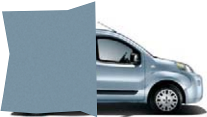
448 - BLEU AZUR