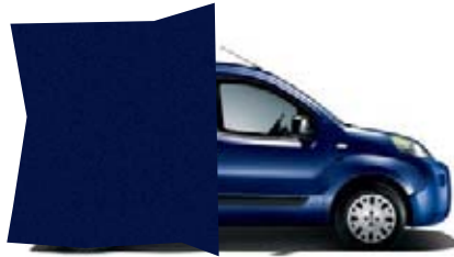
487 - BLEU NUIT