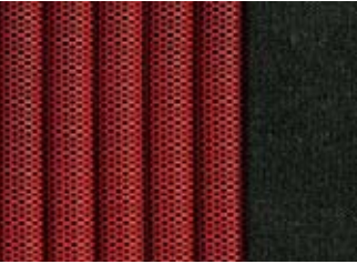
353 TISSU SAIL ROUGE