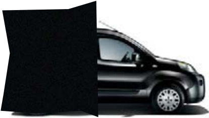
632 - NOIR GRAPHITE