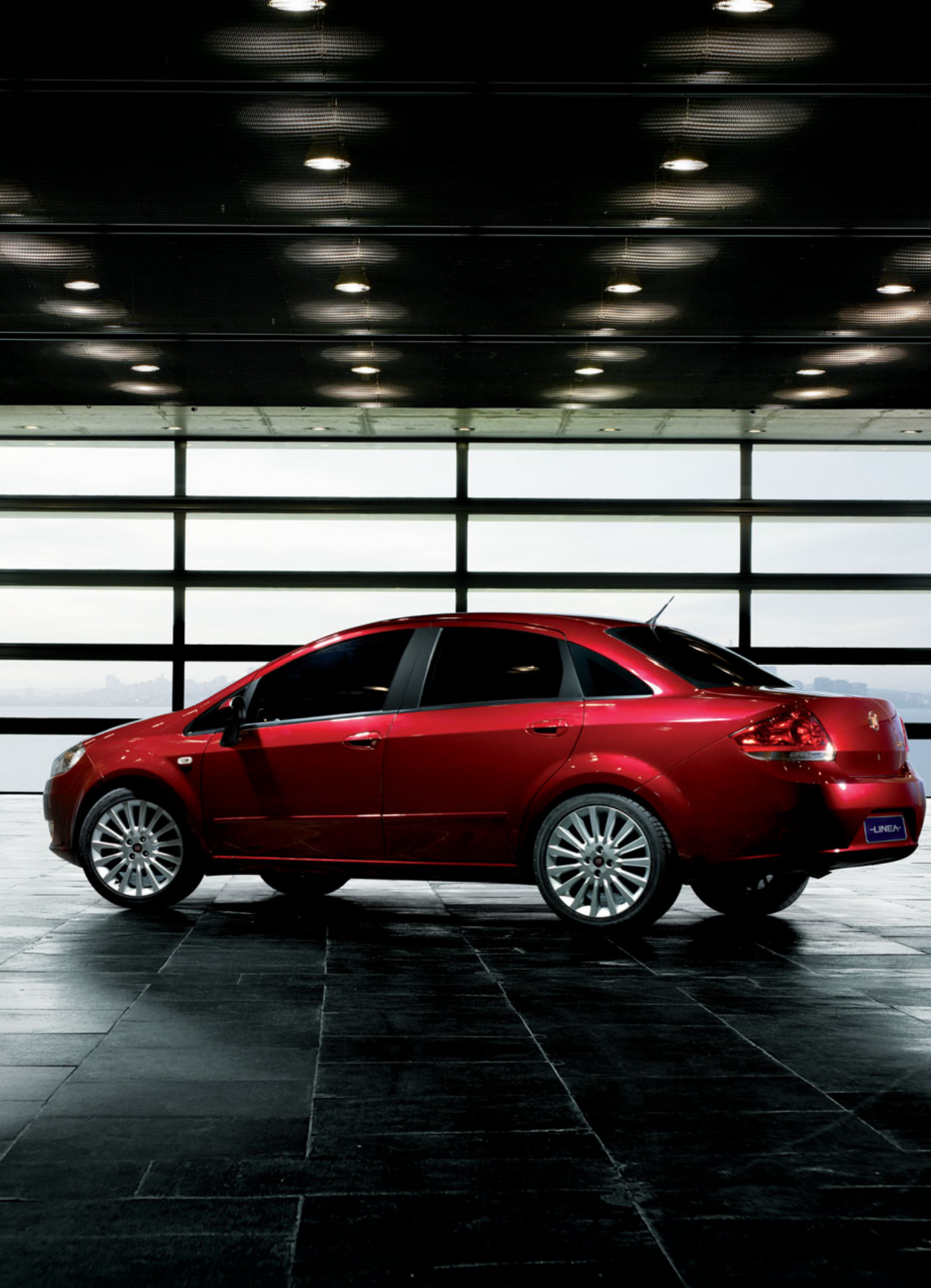
1. Opción 432 Llantas de aleación de 16" 2. Opción 435 Llantas de aleación de 17"

SIGUIENDO LA MEJOR TRADICIÓN FIAT, PUEDES PERSONALIZAR TU FIAT LINEA CON LLANTAS DE ALEACIÓN DE 16" Y DE 17" PARA ENSALZAR EL ASPECTO ELEGANTE Y EXCLUSIVO.