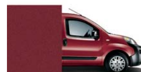
293 Rosso Scuro