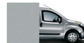
612 Grigio Chiaro