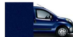
487 Blu Scuro