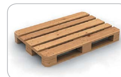
... o fino a 3 Europallet