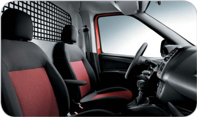
TESSUTO ROSSO 110