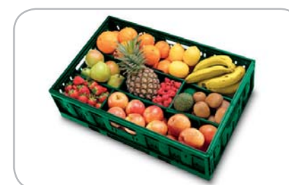
Fino a 33 cassette di frutta...